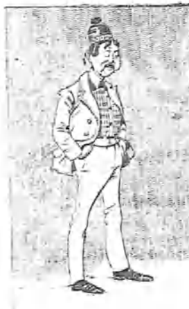
—Por consejo de mi mujercita.