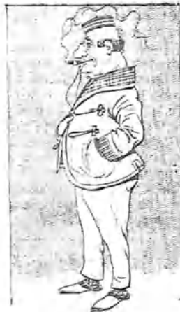
—Porque da cierto carácter de archimillonario.