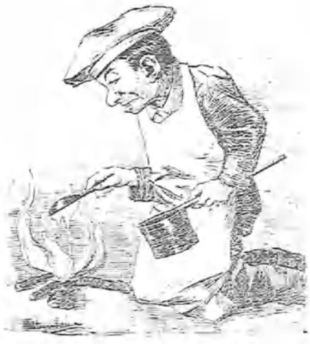
EL QUE ASÓ LA MANTECA

—Dieron muchos en la mana, después de escuchar á un necio, de decirme con desprecio: ¡tiempos de Maricastaña!