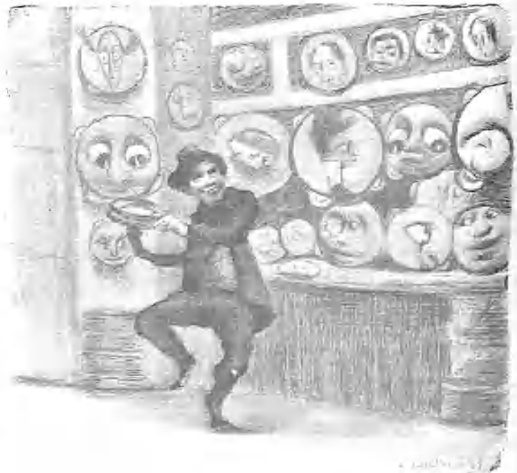
Un puesto de panderetas.