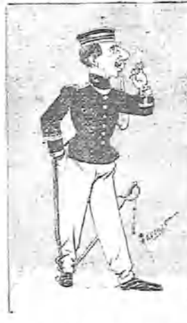
—Porque es preciso para hacer bien la guardia.