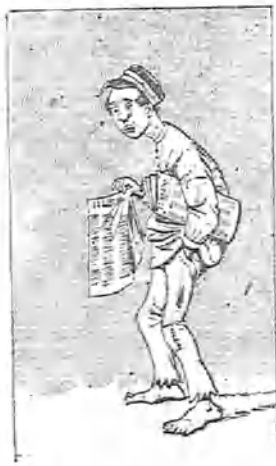
—Por no tener sombrero.