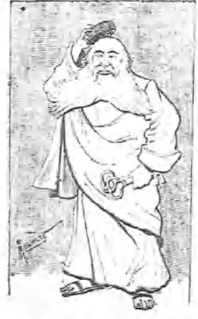
—Porque me lo dice mi mamá y porque me pican los mosquitos.