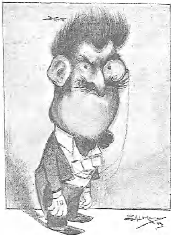
Los hermanos Perroquets, próximos á debutar. (f. s. t. p.)

En infinitas cosas se nota este desprecio y olvido de lo estético, de lo bello por lo bello.