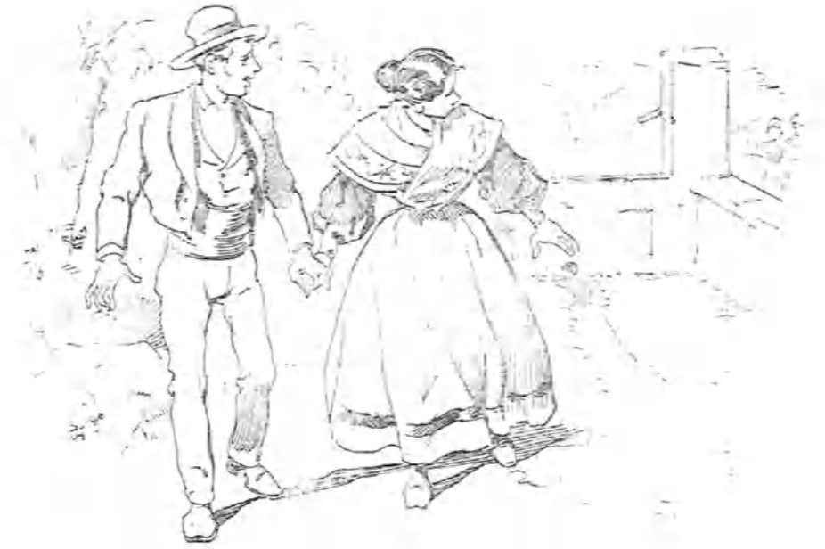
—Creo que viene gente. ¡Huyamos! ¡Es otra pareja!