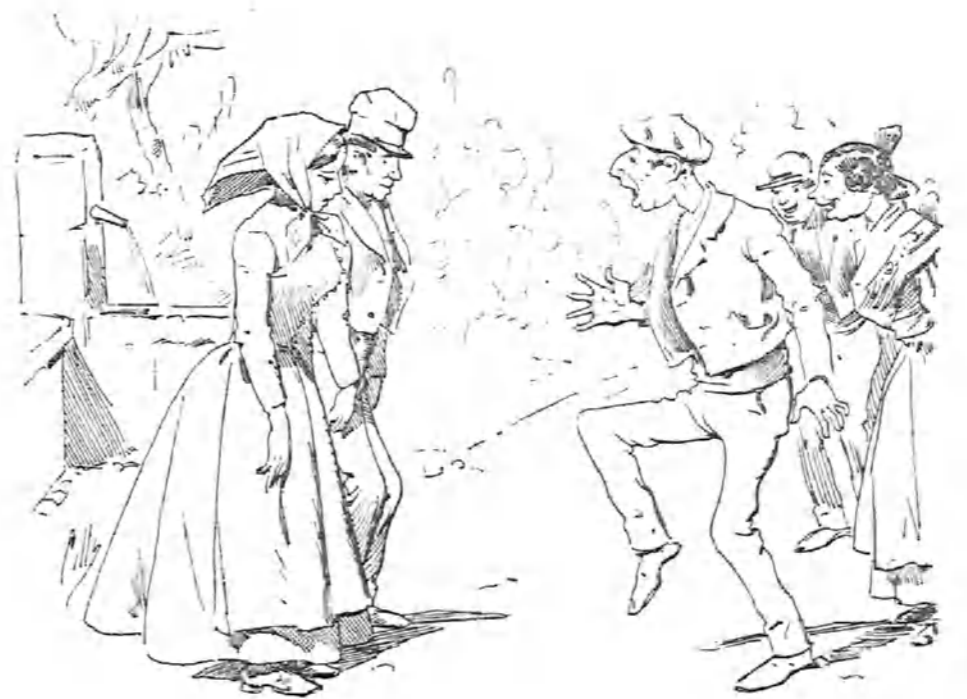
—¡Mi mujer con el sobrino del veterinario!

bresaliente. El salmón que manchó al suspense lo llevaba el sobresaliente para regalárselo al juez más competente del tribunal. Yo sé de algún profesor que, sólo por lástima, dejó de quejarse de algún compañero que, por distracción, dejaba á los examinandos la bola libre en el examen libre . Yo sé de visitas de profesores á establecimientos... de bebidas y enseñanza particular, los cuales profesores convertían en bodas de Camacho los exámenes de aquella... fonda ; y con la alegría todo les parecía después notable y sobresaliente . Y yo sé que si me nombraran á mí inspector, pero inspector de verdad, sin más sueldo que el que tengo y los viajes pagados, antes de pocos meses habría sacado á la vergüenza muchos trapos del mismo color del que se descubrió gracias á la habilidad y energía del marqués de Lema. Sé de maestros, sé de catedráticos que no juegan trigo limpio; y como yo no entiendo el espíritu de cuerpo como algunos que no quieren que se les toque al cuerpo á que pertenecen, tendría vivísimo placer en que, por acto mío, se descubriera quiénes son los