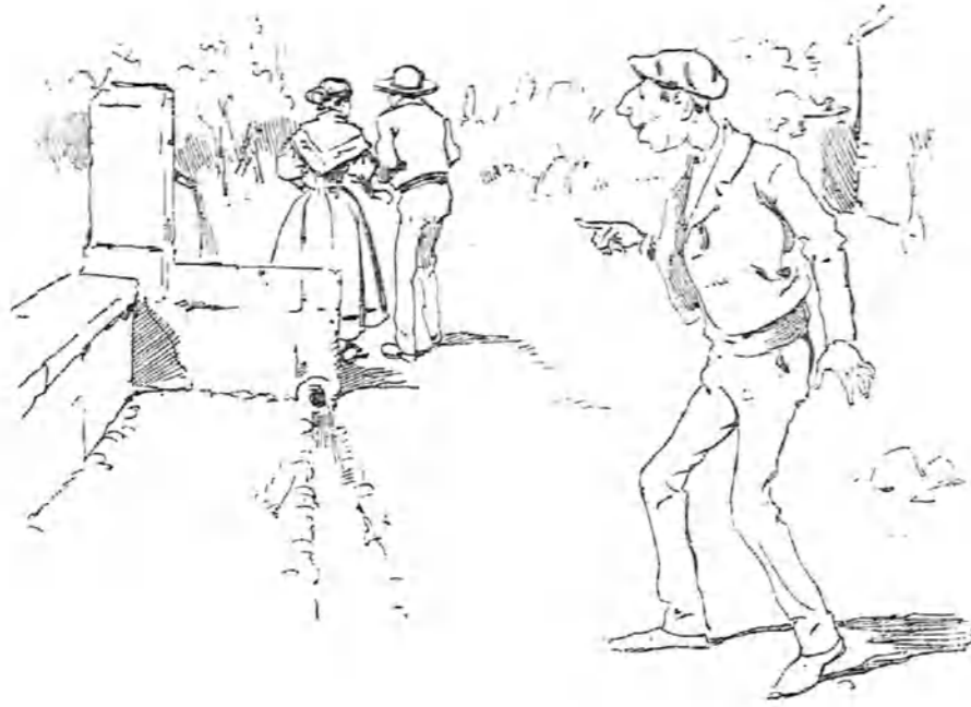
—¡Hola! ¡La mujer del sastre con el hijo del sacristán! ¡Voy á llamar á medio pueblo para que luego no me lo nieguen!

SITUACIÓN CULMINANTE DE UNA ZARZUELA CHICA