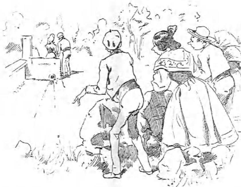
—¿Eh? ¿Que decía yo? ¡Estaban ó no estaban? ¡Vamos á darles un susto para que se les caiga la cara de vergüenza.