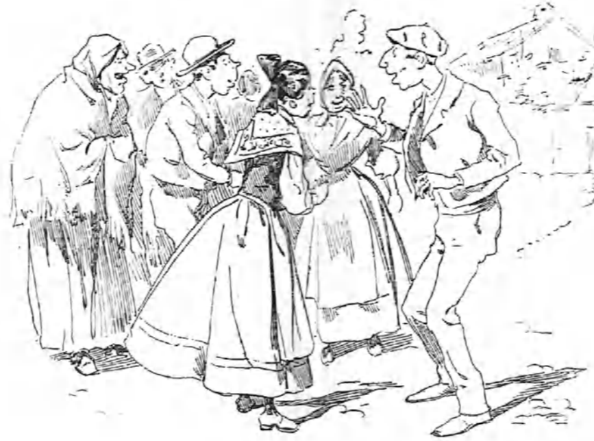
—¡Como lo estáis oyendo! Los acabo de ver ahora mismo junto á la fuente. Y supongo yo que á estas horas no se habrán juntado allí para nada bueno.