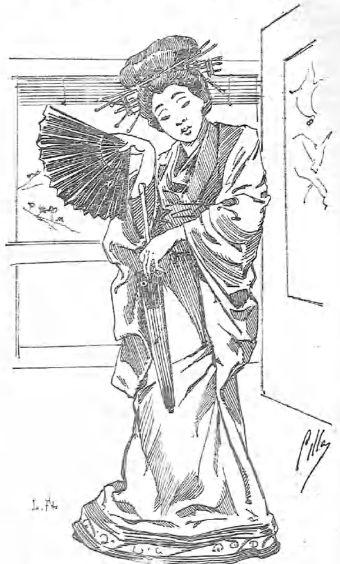
Tiple de Tokio, contratada en diez y seis kalesch (duros).