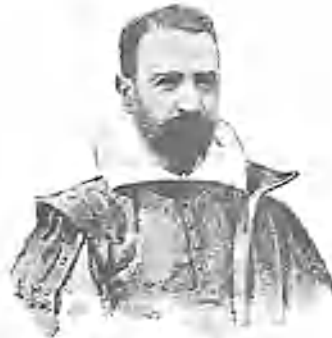
Un Curioso de esta corte.

De todo ello, como ha de dar que hablar, me ocuparé más por menudo en otra estafeta. En la de hoy sólo me resta pedir á Dios nuestro señor dé á nuestros comediantes una humildad que sería alivio de no pocos males y á vuestra merced la salud y los aumentos que yo le deseo.