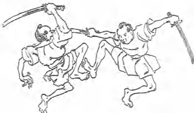
Ejercicios prácticos de la segunda reserva.