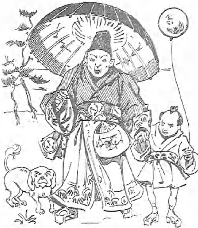
Mandarín engañando á su hijo mayor con traidores halagos para conducirlo al colegio.