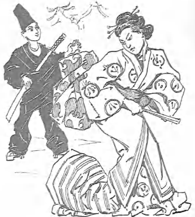
Costumbres coreanas.—Los primeros vrigidos de la pasión.