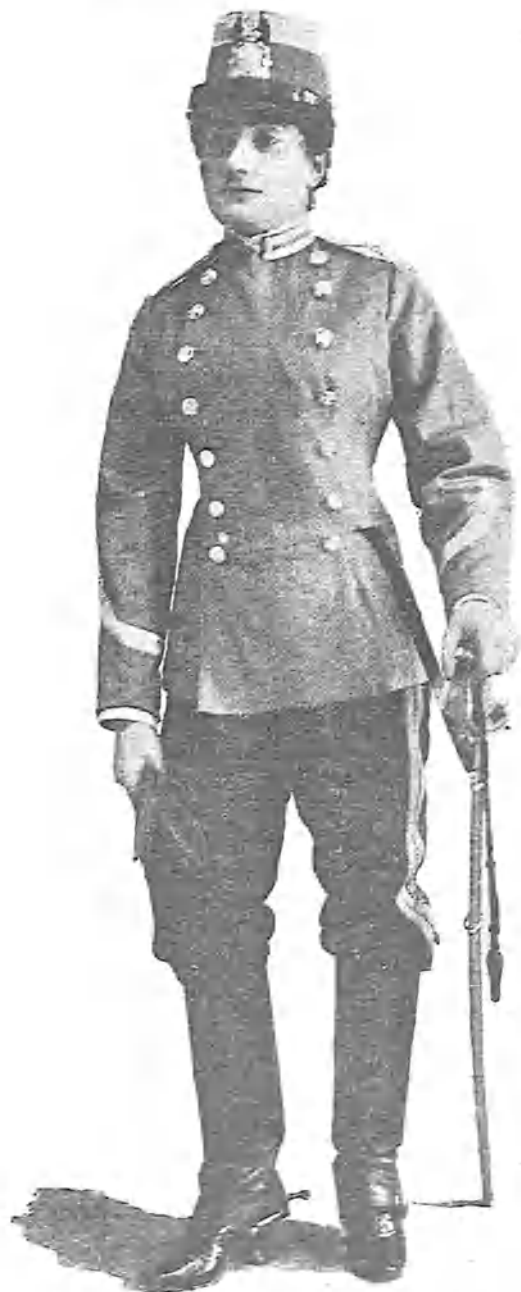
En la zarzuela Campanero y sacristán.