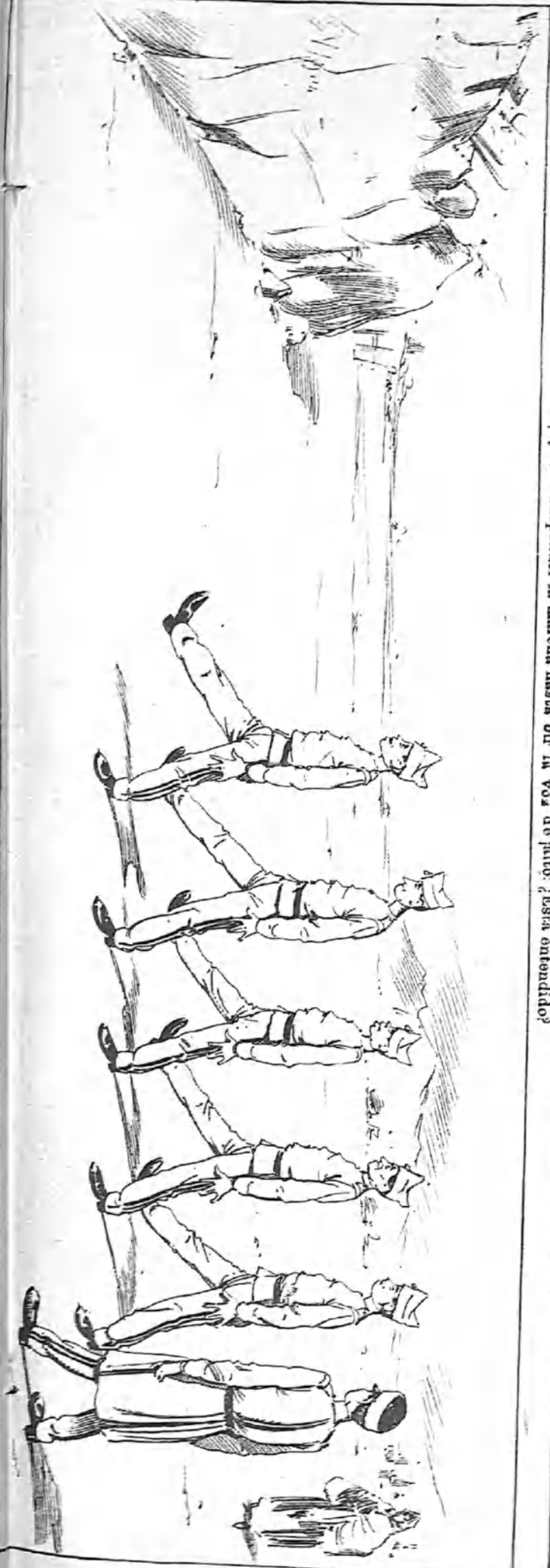
De frente... ¡March!