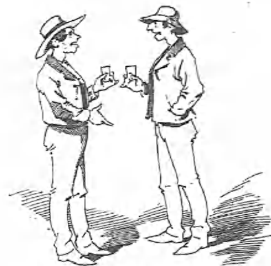
Echando unas chicuelas de aguardiente se conoce la gente.