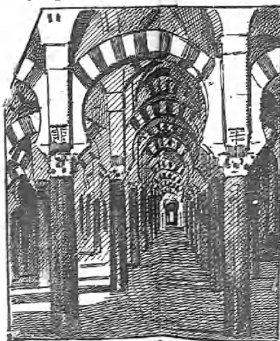
Interior de la Catedral.