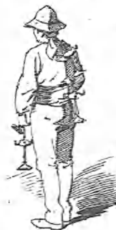
El velonero de Lucena.