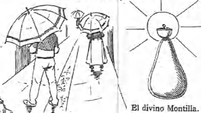
Aquí son muy apreciados los paraguas encarnados.