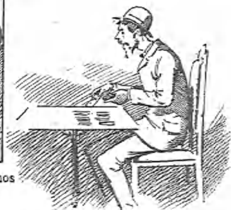
Y ahora... ¡¡¡jasiendo solitarios!!!