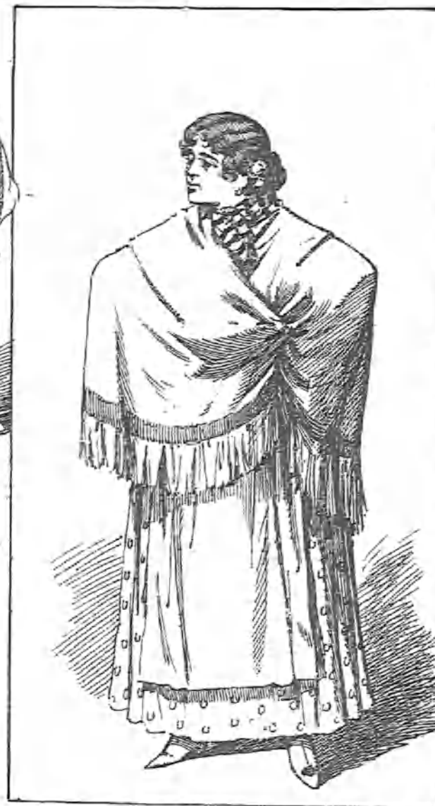
Aunque hubiera únicamente cordobesas en el mundo, creo que sería cosa de nacer con mucho gusto.