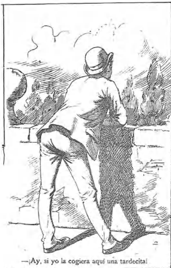
—Ay, si yo la cogiera aquí una tardecita!