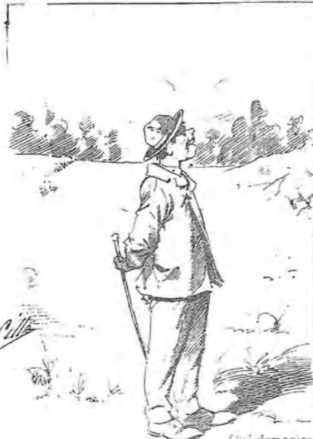
—¿Qué demonios han hecho de estos eriales que no los han sembrado de garbanzales?