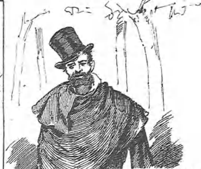
—¡Qué sitio más hermoso para!... Baraja si tengo; pero falta quien apunte una pesetilla. ¡A no ser que me entretenga en hacer solitarios!