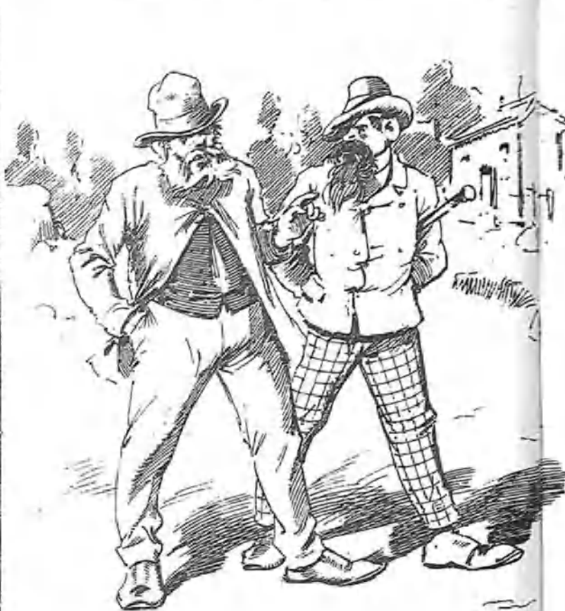
—Desengáñese V.; aquí catorce baterías, y no quedaba ni rastro de San Francisco el Grande!