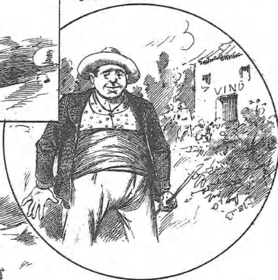
—Pus señor, estos matorrales pausen cajas de sorpresa. Vaya una gana de coger humidá que tienen algunos!