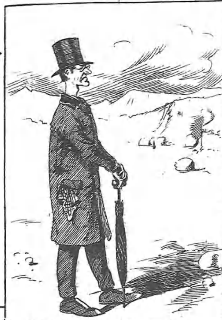
—Si el Ayuntamiento me cediera este solar, yo edificaría un asilo benéfico para las Hermanitas de los ancianos .