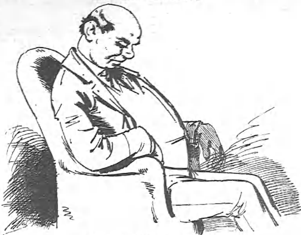
Viendo un drama con problema.