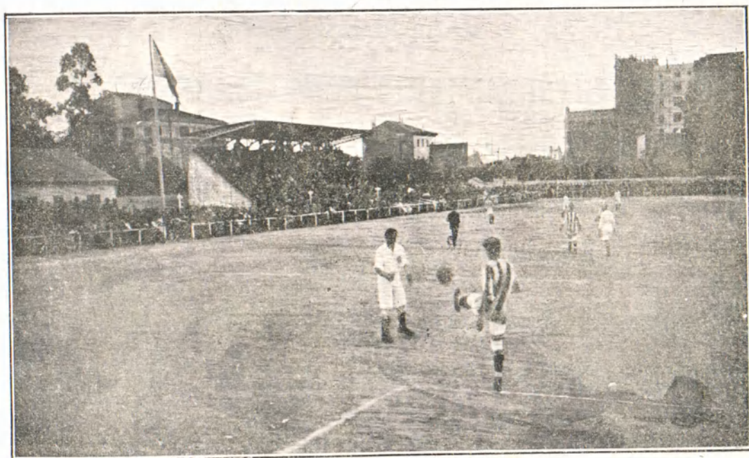
Un momento del partido.—«Real Sociedad de San Sebastián» contra el «Madrid F. C.» á beneficio de la Cruz Roja.