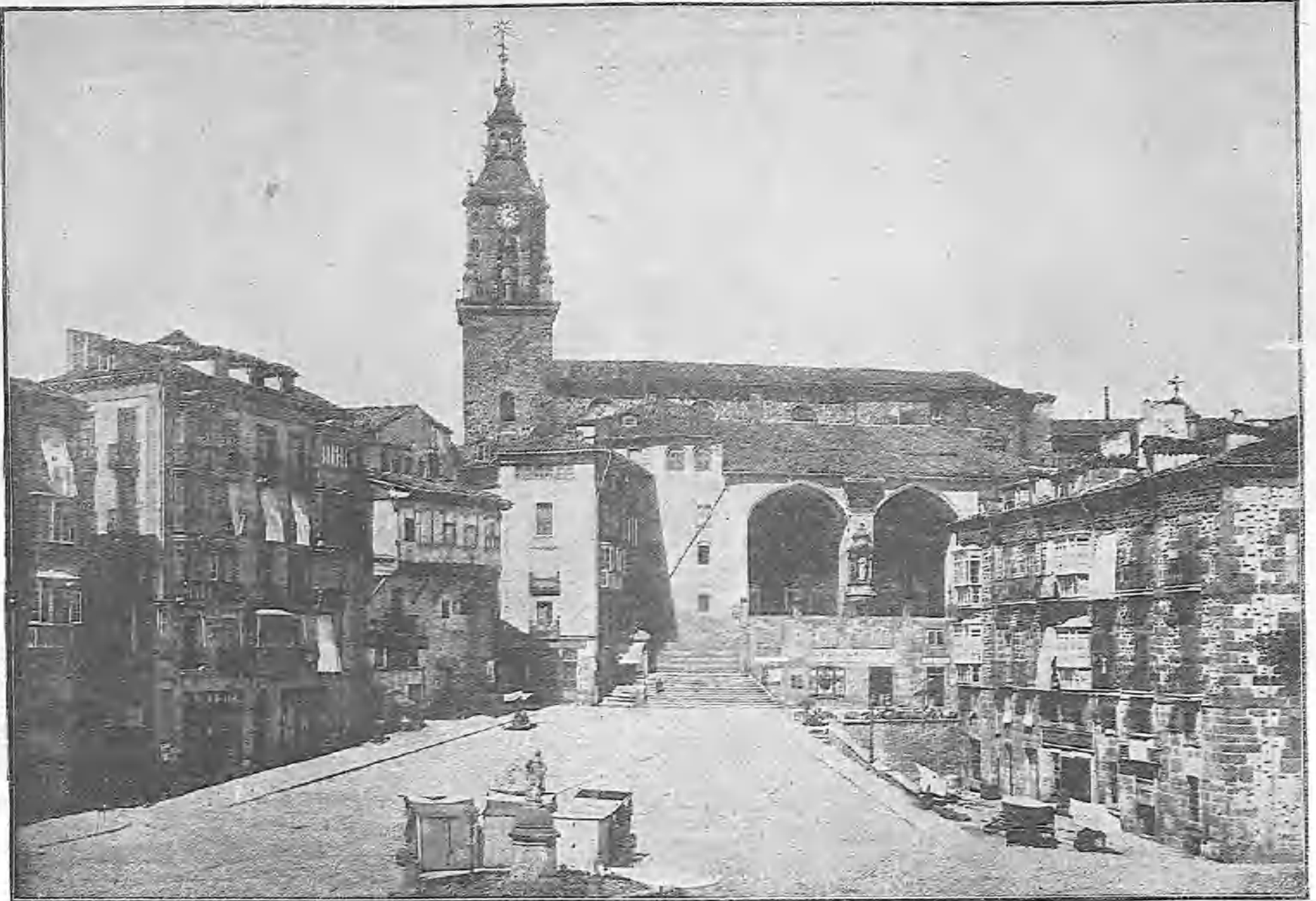
PLAZA DE LA CONSTITUCION EN VITORIA, CAPITAL QUE HA VISITADO HOY S. M. EL REY