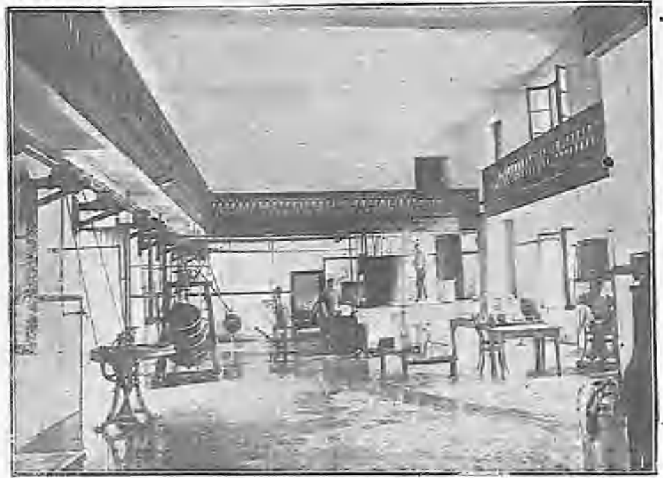
INTERIOR DE UN TALLER DE MAQUINARIA PARA LA FABRICACIÓN DE QUESOS Y MANTEQUILLAS