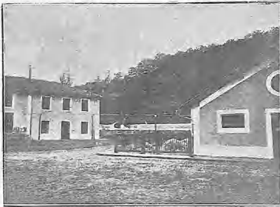
ESTABLOS, GALLINEROS, COCHINERAS Y EDIFICIOS EXTERIORES DE LA FÁBRICA DE QUESOS Y MANTEQUILLAS