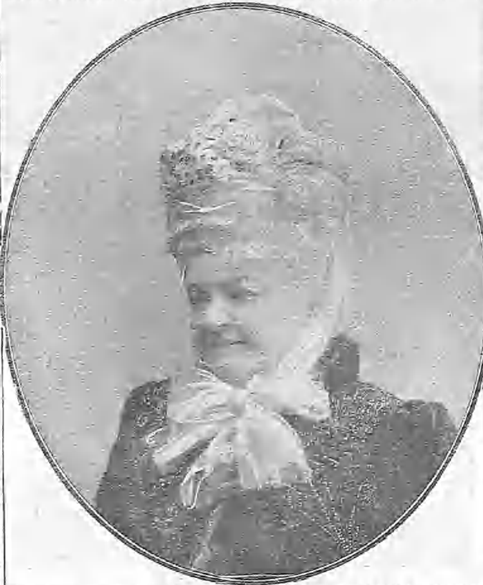
LA ILUSTRE ESCRITORA DOÑA EMILIA PARDO BAZAN, ORGANIZADORA DEL BAILE DE CARIDAD CELEBRADO EN LA CORUÑA Á BENEFICIO DEL SANATORIO GALLEGO DE MADRID Y DE LAS ESCUELAS ESCOLARES DE AQUELLA CIUDAD

á esos hombres pacientes que erigen catálogos, que anotan fechas, que copian inscripciones, que traducen epitafios, que trasladan á unos pequeños trozos de papel recio palabras misteriosas y arcanas, cuyo sentido es para ellos ignoto, cuyas significaciones permanecen ante ellos inexpresivas, cruelmente impenetrables. ¿Qué es la vida para estos ordenadores de catálogos?