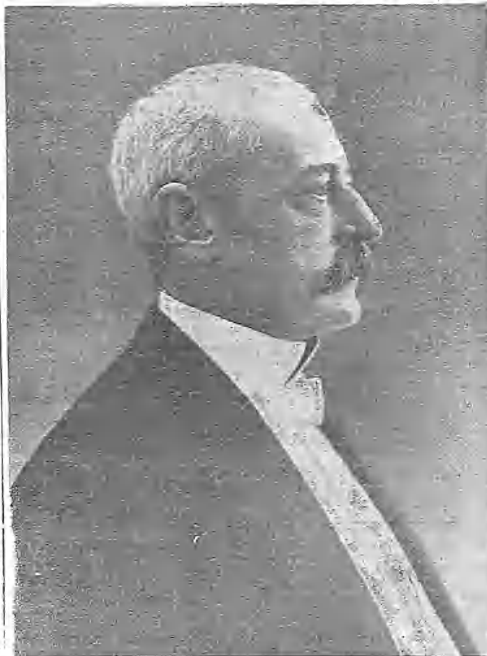
El ilustre estadista francés, que á pesar de sus inclinaciones conservadoras, puso desde el Gobierno un alto espíritu de justicia, de paz, de humanidad, de misericordia, en las cuestiones sociales