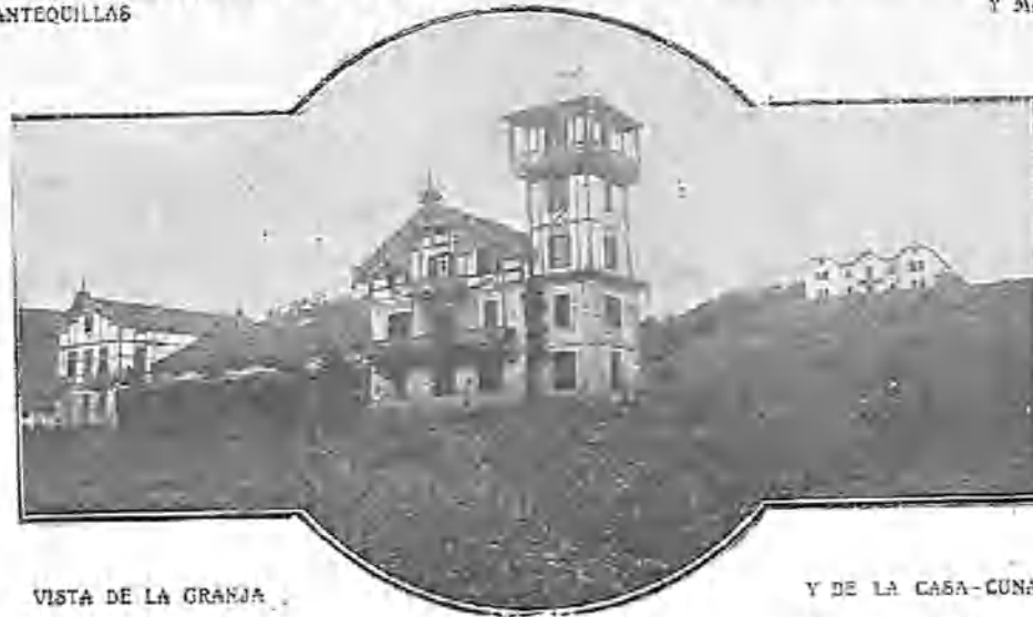
VISTA DE LA GRANJA