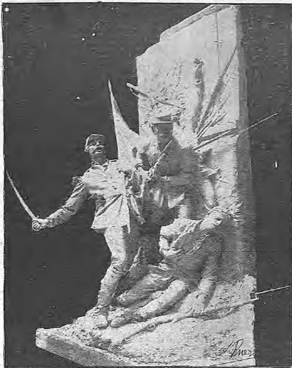
EL ÚLTIMO CARTUCHO