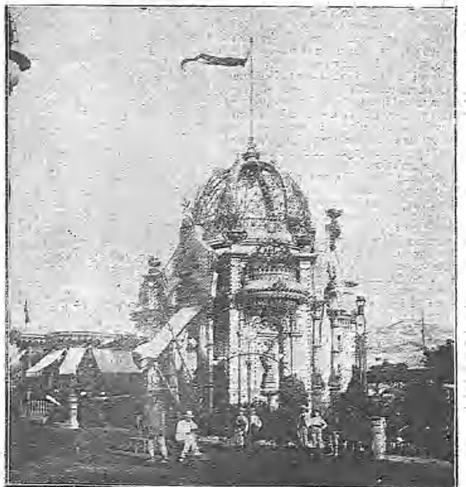
PABELLON DEL AYUNTAMIENTO