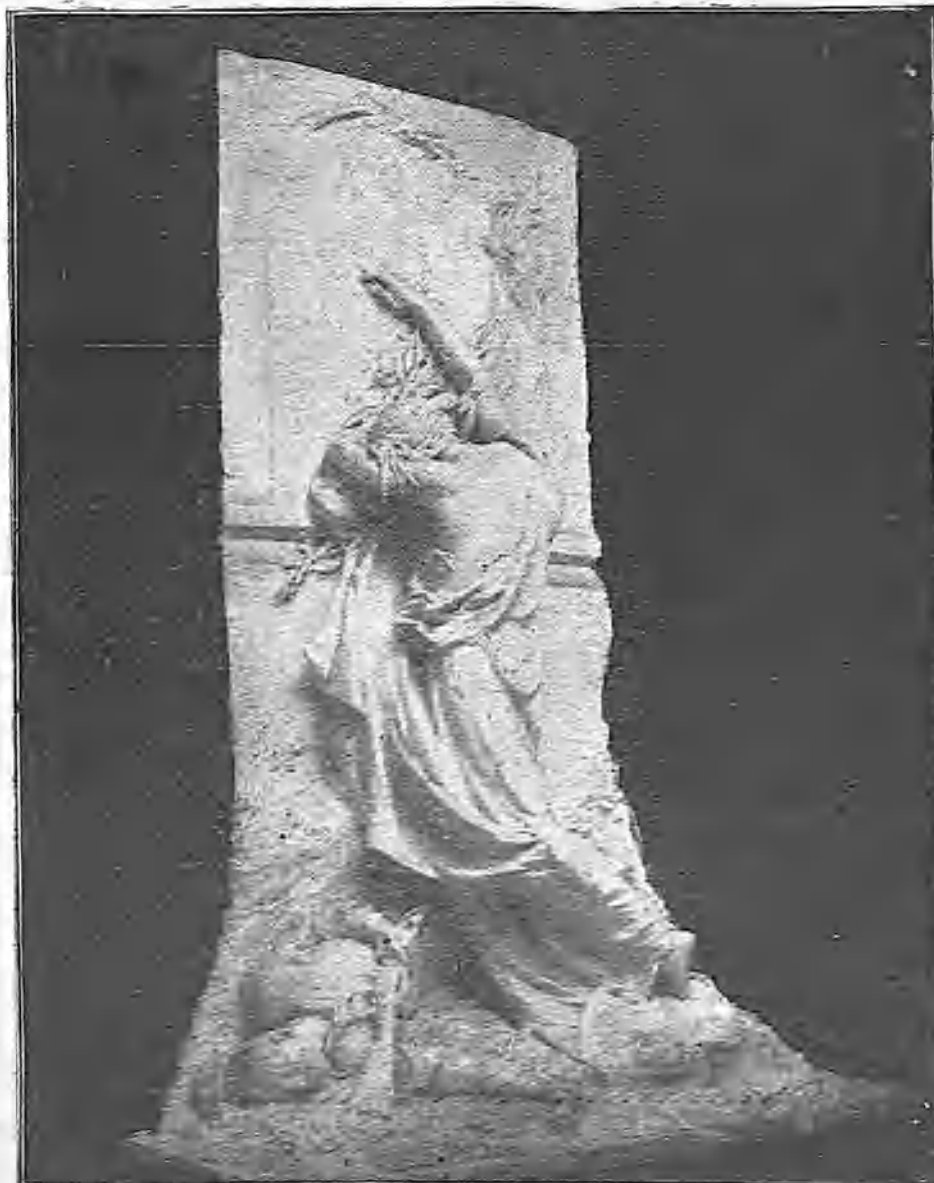
LA HISTORIA INSCRIBIENDO LAS HAZAÑAS DE LOS HEROES

Cuando el almirante inglés Hedworth Lambton regresó de China llevó con él á Londres un raro perrito japonés, que lo tenía desde que era