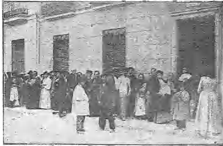
EL PÚBLICO ESPERANDO VEZ ANTE LA OFICINA DE LA CALLE DE LOS MARTIRES DE ALCALÁ

tro no le sean onerosos, sino que, por el contrario, como acontece en Italia, en Suecia, Dinamarca y Bélgica, tengan un premio remuneratorio, tanto por dedicarse á ellos como por su aplicación en las Escuelas.