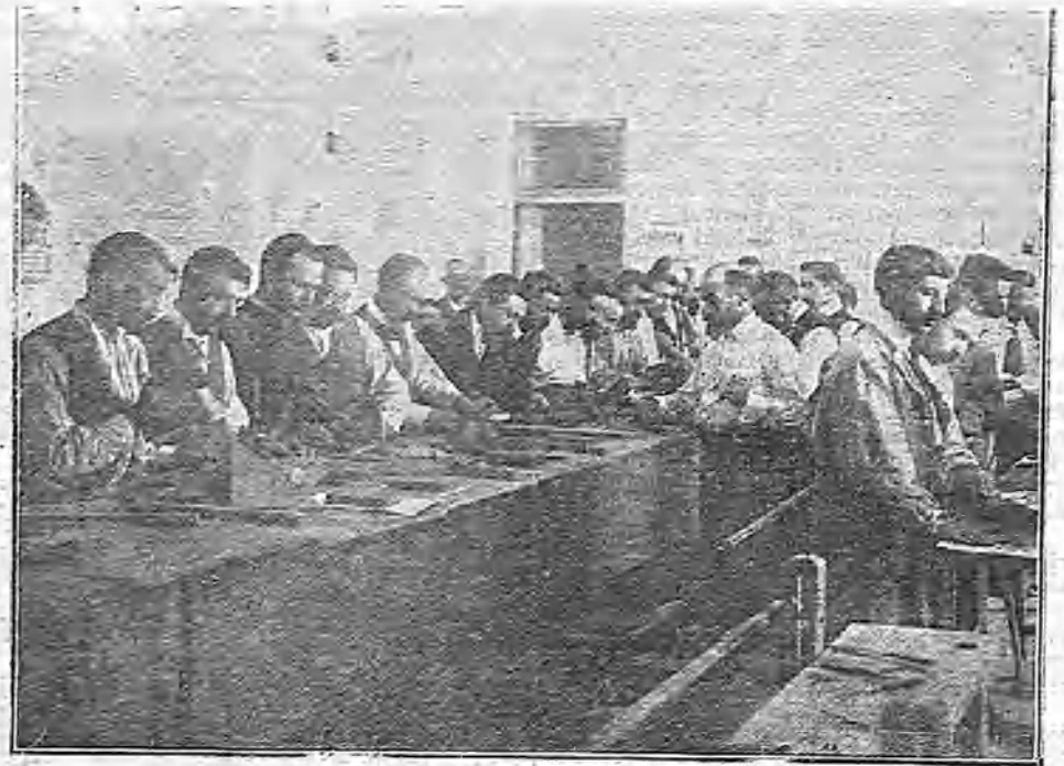
TRABAJOS EN MADERA Y MODELADO EN BARRO