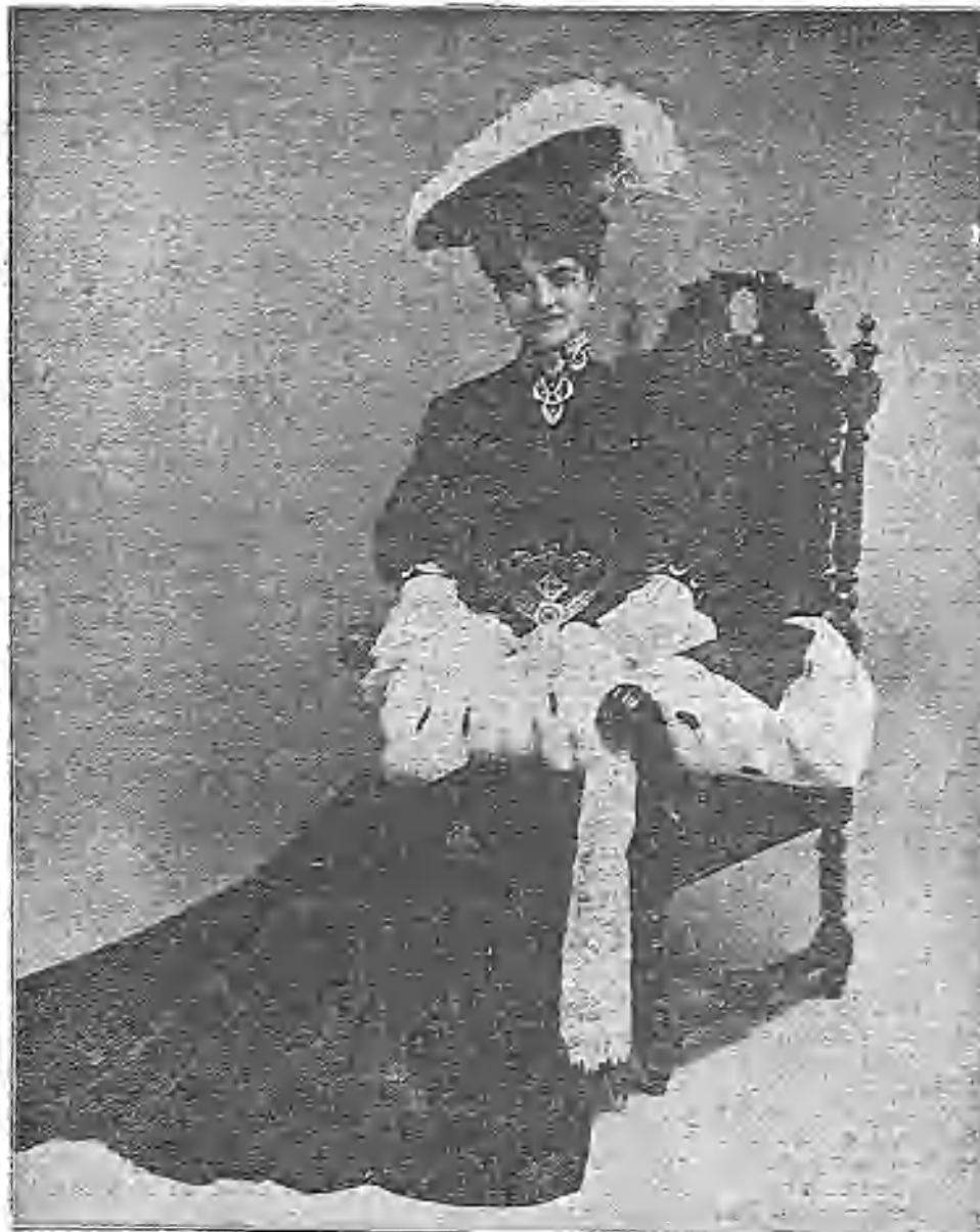
Joven y linda actriz española, aplaudidísima y admirada actualmente en los teatros de Londres