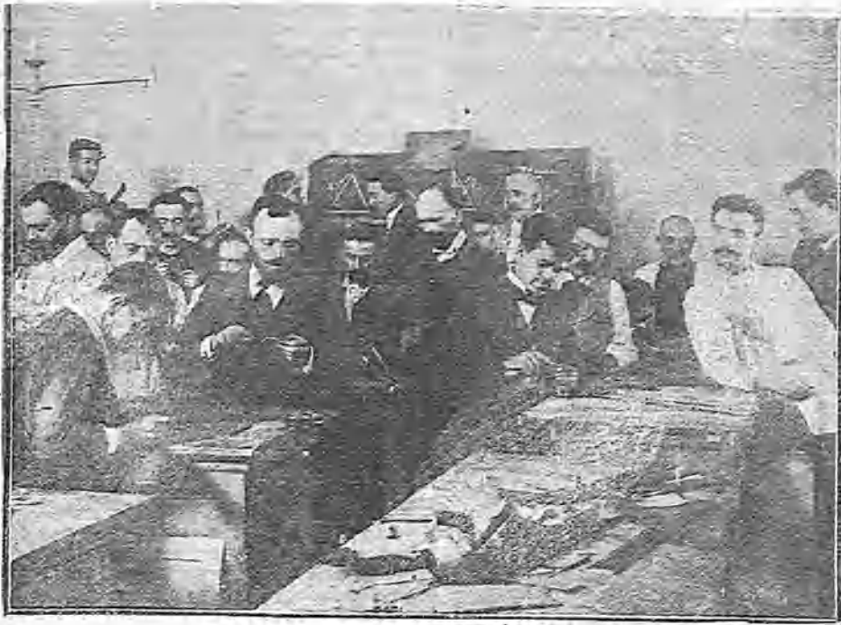
TRABAJOS EDUCATIVOS EN CARTÓN Y EN ALAMBRE