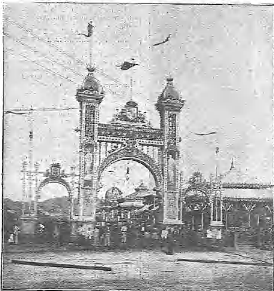
ARCO DE ENTRADA Á LA FERIA