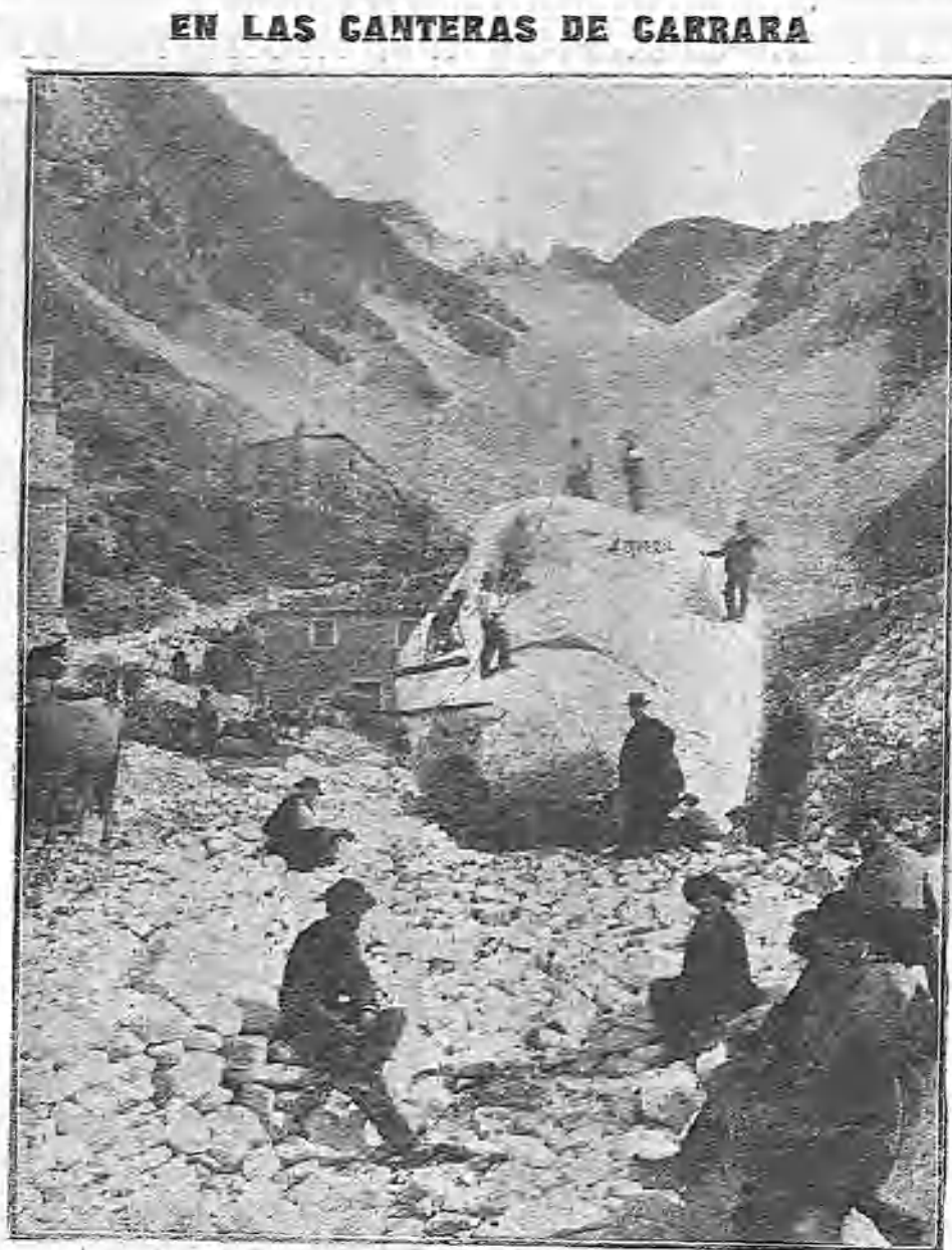
GRAN BLOQUE DE MÁRMOL EN QUE SE HAN LABRADO LOS PEGASOS DE QUEROL QUE HAY DE CORONAR EL FRONTISPIO DEL MINISTERIO DE INSTRUCCIÓN PÚBLICA

Desde aquel día pasa tres ó cuatro veces durante la tarde por delante de casa, y por las noches toca el acordeón enfrente. Al otro joven, que, como te dije, gustaba también de la niña, le hemos despedido, porque resulta que la tía, si bien está muy mala, no tiene más que unos 6.000 reales, y para eso piensa repartirlos entre el cura, el sobrino y los dos gatos. Además, el chico tiene humor escrofuloso, según dice aquí todo el mundo, y eso que él lo oculta, y ya tuvo