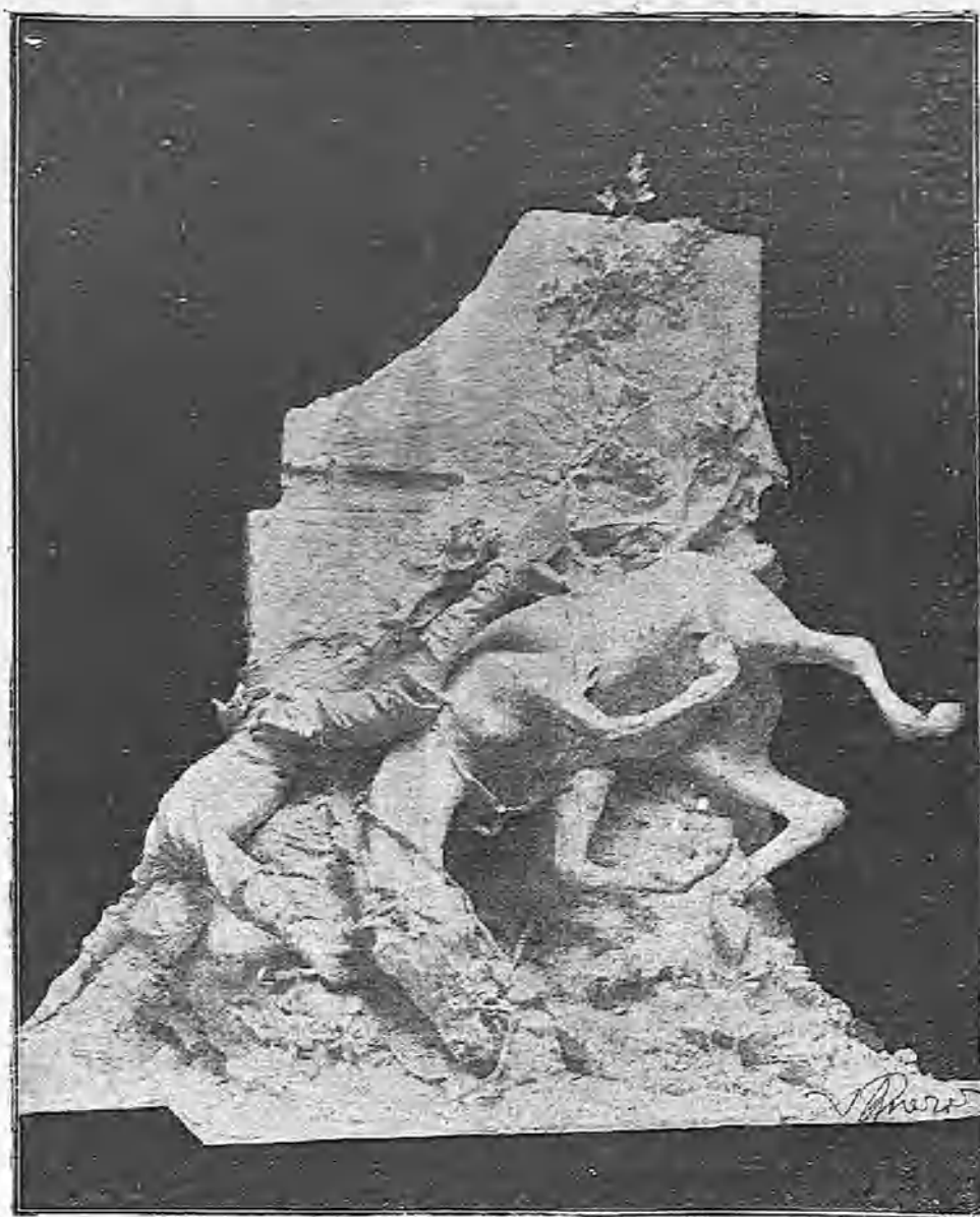
UGARTE Y SU CABALLO