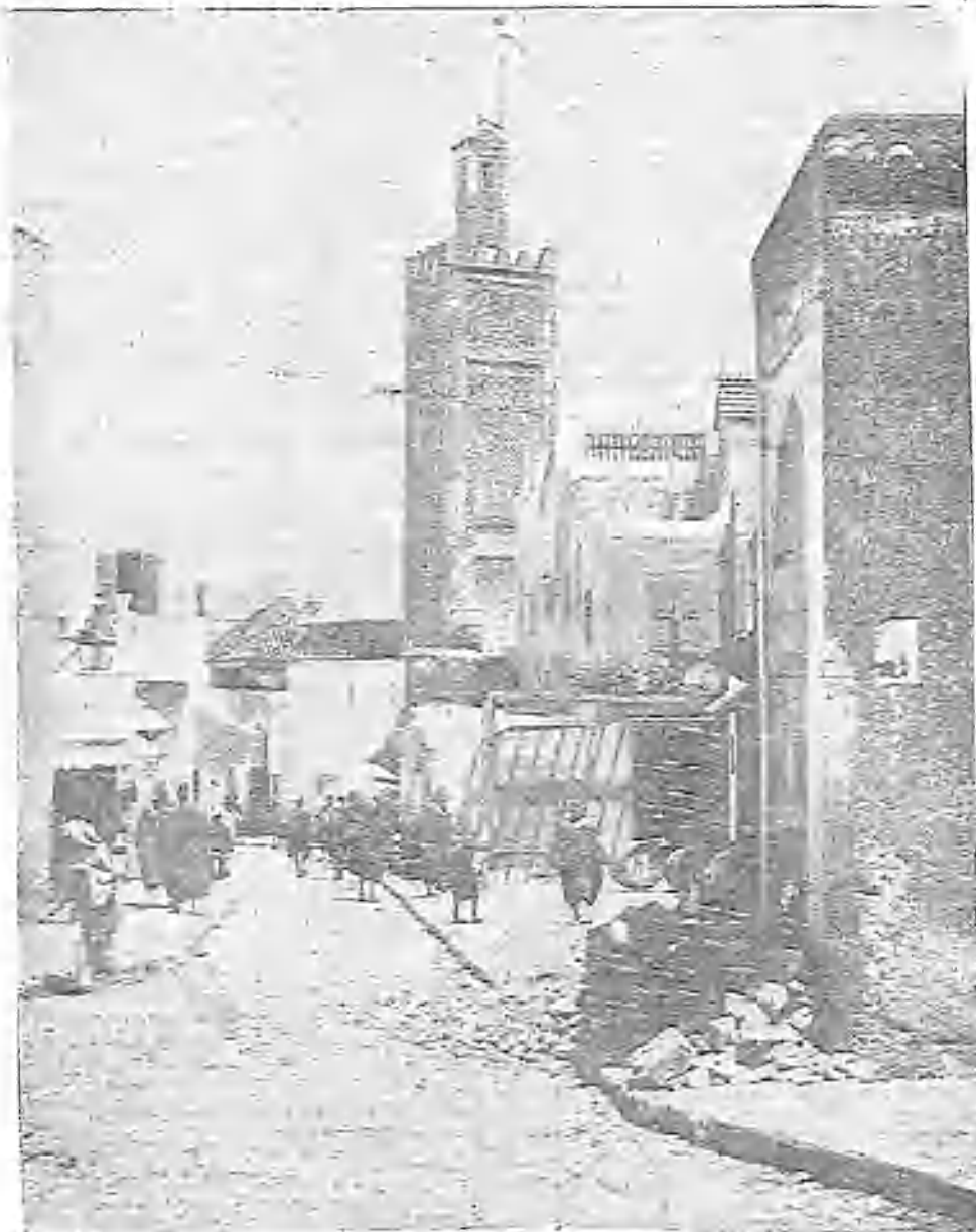
UNA VISTA DE TÁNGER

Mejoran de momento las noticias. Las gestiones particulares entabladas por los súbditos americanos que fueron á Arzila para facilitar las negociaciones, parece que han dado los resultados que se esperaba. Celebraron una entrevista con un cherif de la kábila de Beniarrós, llamado Sidi Baraka, quien prestó su intervención, aunque con ciertas reservas, por estar ya los Gobiernos en negociaciones. Han salido de Tánger correos exprosos para Raisuli con copias de las cartas mandadas por el Sultán, esperándose que estas cartas y el envío de rehenes «ablondarán» el corazón del célebre secuestrador. Marruecos continúa siendo la «actualidad palpitante», y nosotros tratamos de reflejarla en esta página.