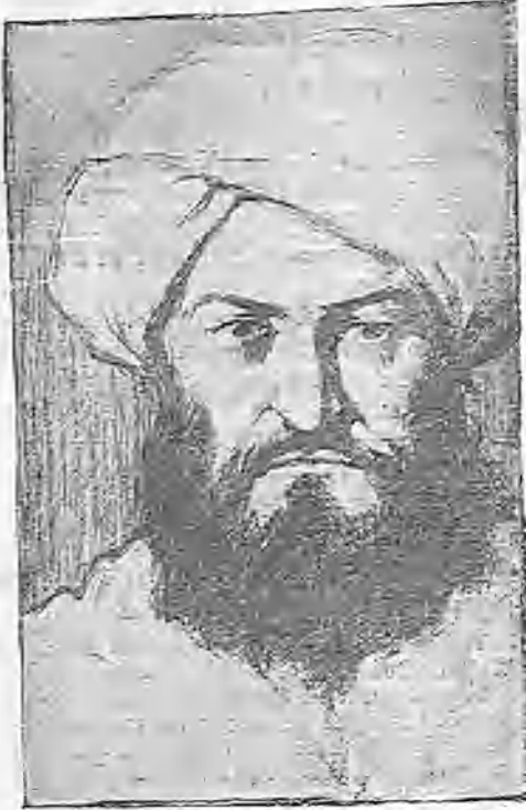
RAISULI, EL SECUESTRAADOR DE LOS SEÑORES PERDICARIS Y WARLEY, Y PROMOVEDOR DEL ACTUAL CONFLICTO ENTRE MARRUECOS Y LOS ESTADOS UNIDOS