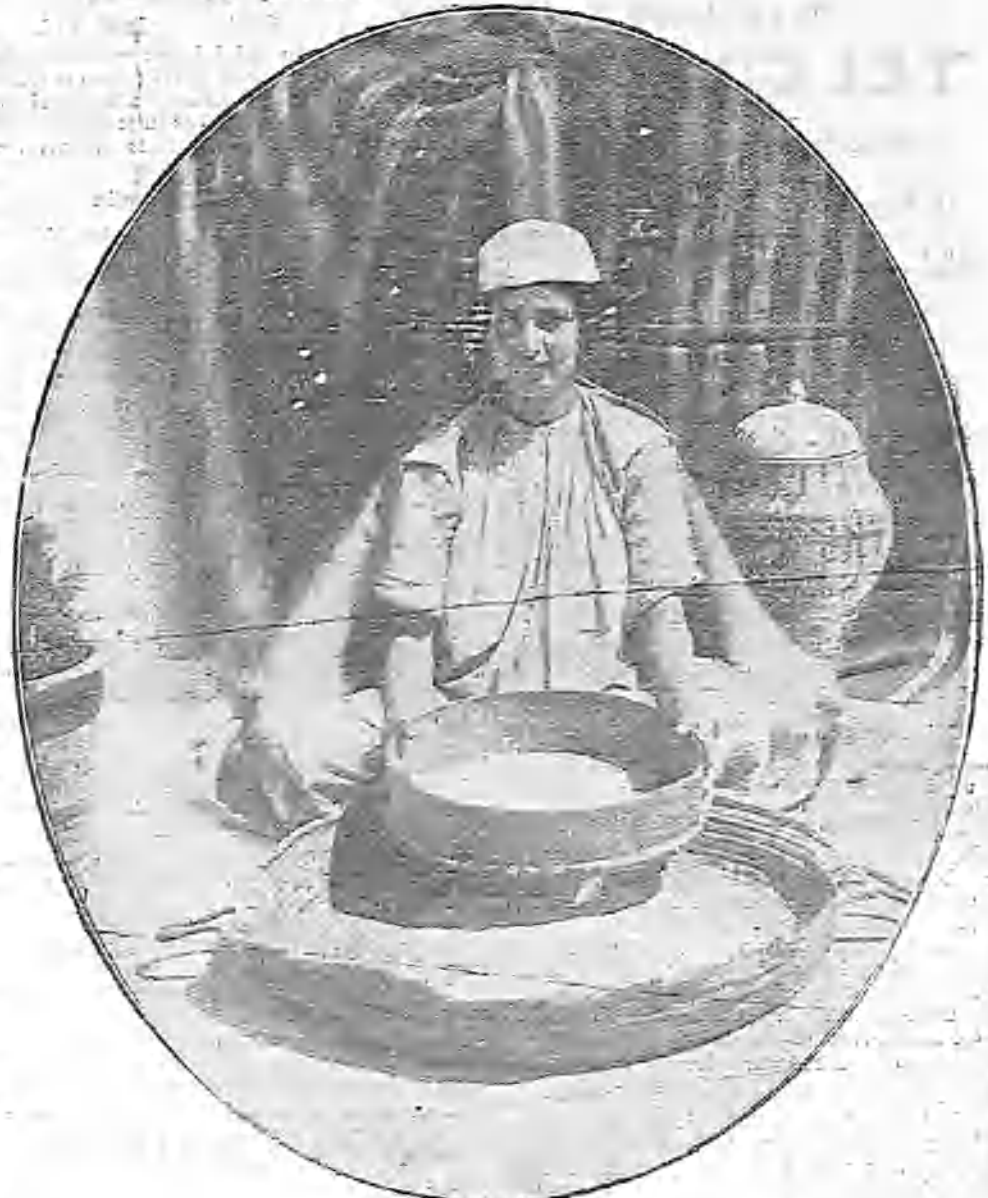
UNA MORA HACIENDO ALCUZCÚZ

Puntal..... 12,90 metros. Calado..... 7,42 — Desplazamiento, 10.700 toneladas. Sus elementos defensivos los constituyen cuatro cañones de 187,3 milímetros de tiro rápido, en barbetas de acero endurecido de 110 milímetros de espesor; seis cañones de 150 milímetros de casamatas del mismo espesor que las barbetas, dos de 12 libras, 23 de tres libras, dos Maxim y dos tubos lanzatorpedos submarinos. Las máquinas de este hermoso buque se componen de dos juegos de triple expansión, instaladas en compartimentos estancos separados. En los últimos días de Abril, y con destino también á la Armada inglesa, tuvo lugar en el arsenal de Chatham la botadura del crucero acorazado de primera clase Devonshire , que es el primero de quilla plana puesto en grada en Marzo de 1902. Sus características principales son: Eslora..... 135 metros. Manga..... 20,58 — Calado..... 7,50 — Desplazamiento, 10.745 toneladas.