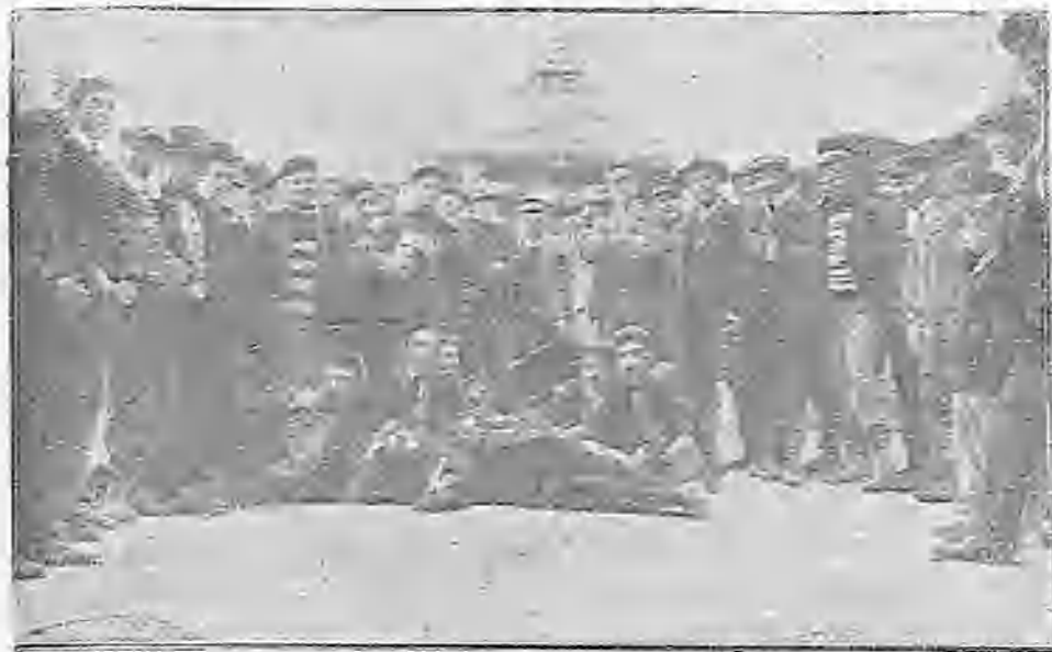
GRUPO DE LOS QUE TOMARON PARTE EN LA CARRERA DE RESISTENCIA DE VALLADOLID Á PALENCIA

Se les encuentra generalmente, aunque diseminados, en la región comprendida entre el Adamaona y el Camerón, ocupada por los indígenas de lengua bantú . Se diferencian de sus ve-