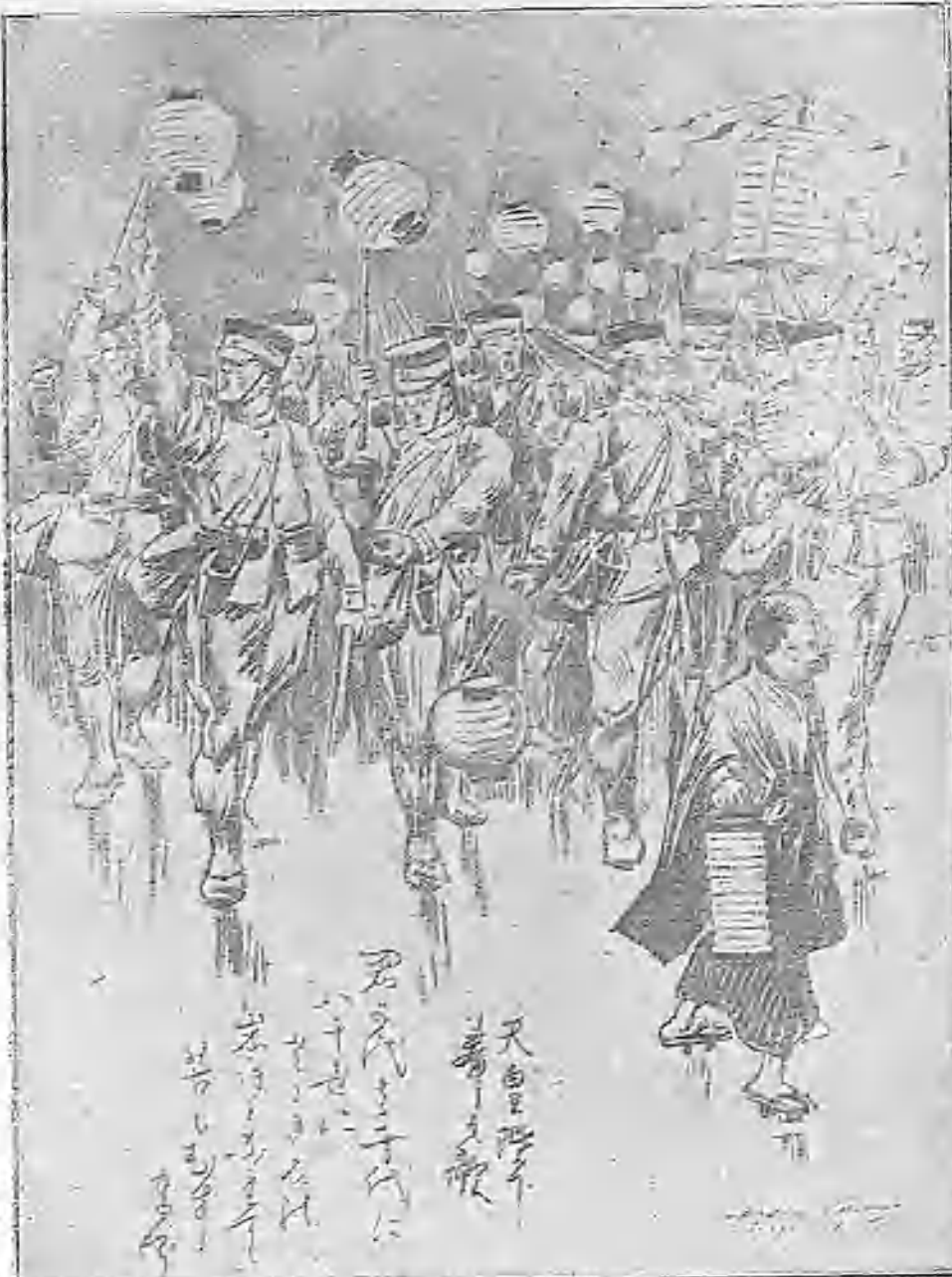
RETRETA EN TOKIO.—LOS SOLDADOS ENTONAN CON DELIRANTE ENTUSIASMO EL HIMNO DEL KIMIGAYO