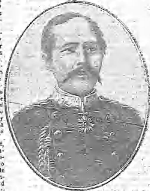
EL GENERAL OKU, UNO DE LOS HÉROES JAPONESES EN LA ACCIÓN DEL YALU

Y depositando una moneda en la rugosa mano de la vieja, bajó las escaleras de piedra y pude ver que era una mujer madura, con esa otoñal belleza que tanto suele impresionar a los mozos.