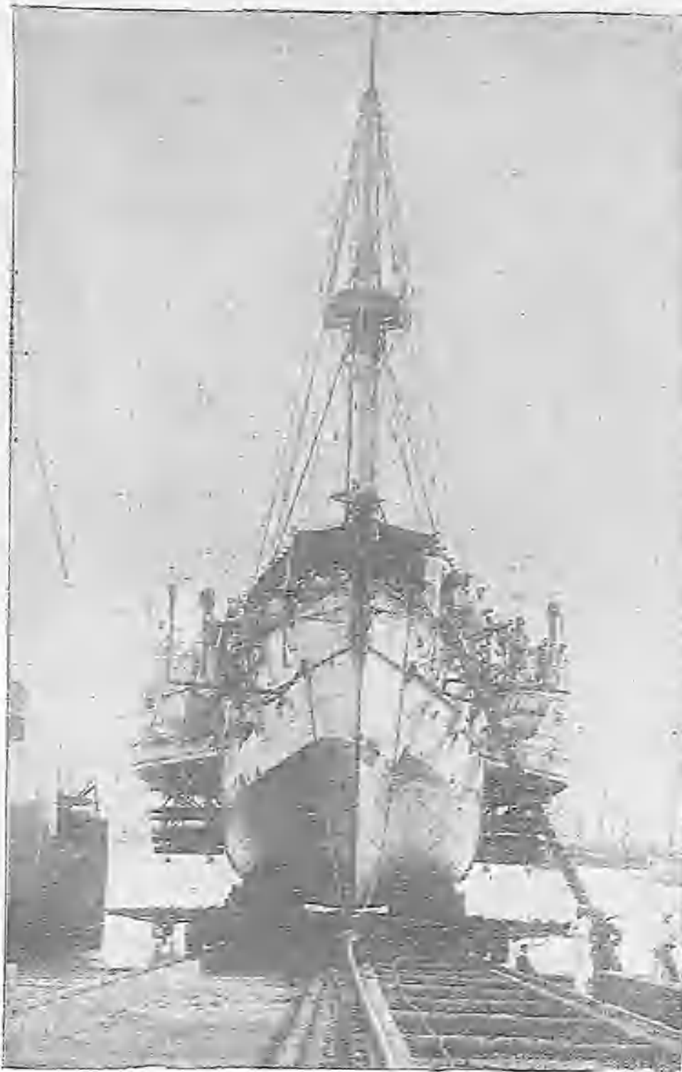
BOCADURA DE UN BUQUE DE GUERRA RUSSO

Respecto á los efectos del radium sobre el ojo ciego, importa determinar si se trata ante todo de una ceguera completa ó de un órgano en posesión todavía de algún poder visual. Esta última imperfección, que está clasificada como ceguera ordinariamente, porque es tan débil la visión que en la práctica es igual á la ceguera absoluta, tiene dentro del terreno de la fisiología una diferencia considerable, puesto que existe