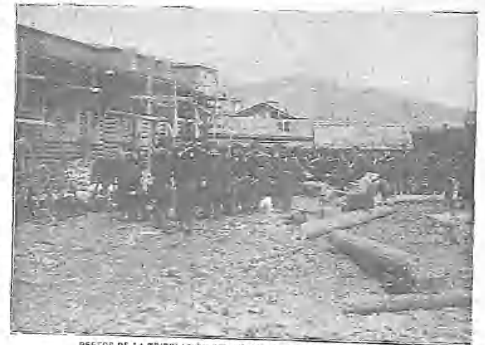
RESTOS DE LA TRIPULACIÓN DEL "VARIAG" VOLVIENDO A LA GUERRA

La marquesa de Squilache rogaba á sus amigos que fueran á visitar la Exposición de Pinturas el lunes por la tarde, habiendo cedido el ministro aquel día los ingresos en beneficio de las clases del Círculo de Bellas Artes. Con su