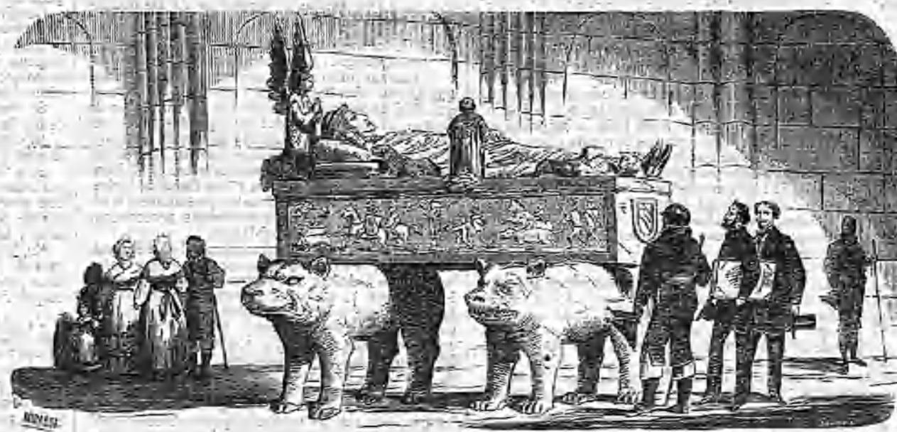
Coruña.—Sepulcro de Fernán Pérez de Andrade (ó E 60.)