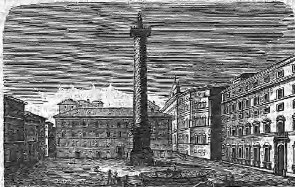
Plaza Colonna. — Columna de Antonino Pio.

dan análoga constitución las Academias y las mismas denominaciones y los mismos fines, corrigirá la efeméride anterior, adaptándola al gusto de la época, en esta forma: "1535.—Empieza Soliman el pta de Viena."