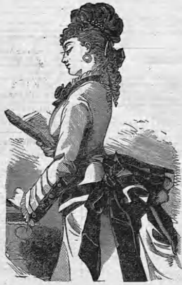
Cuerpo y sobre-falda de lana de verano, gris perla, con guarniciones de terciopelo negro.