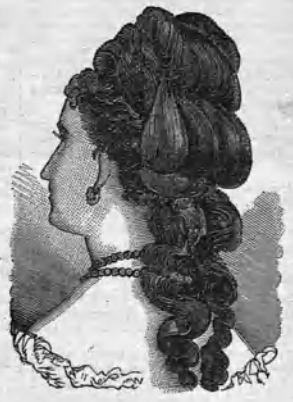
Peinado de soirée.