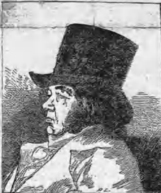
D. Francisco de Goya y Lucientes.

¡Qué voz! ¡Tú, tú, aplicando al mensajero, al liberto de César! ¡Y para eso me llamas, para ver tu ventura y tu degradación! Por Hércules, que el manebao es jóven, hermoso, gallardo; y la Reina fánci, voluptuosa, insaciable. Voy, Cleopatra, en sus labios descoloridos, en tus ojeas moradas, en tus retinas extinguidas, en la palidez mortal de tu semblante, que has consagrado la noche al dolor mientras la consagraas yo á pensar en el placer, menso que me han traído tus amores. ¡Ah de mis guardias! ¡Cojed á ese liberto, desnuadme y heridme, aporadme fuertemente con varas flexibles, basta tanto que su sangre haya salpicado los pórticos de este palacio; y si él mesterar, la frente de mis ojos Octavio, le enseñe tu cuerpo amonido y se queja, dile que allí tiene á mi liberto Hércules aporrido en buen hora como yo te azoto á tí, y que quedemos mutuamente pagados. Ahora, Cleopatra, escoge el género de muerte que más te cuadre. Vengo resuelto á matar, porque vengo resuelto á mo-