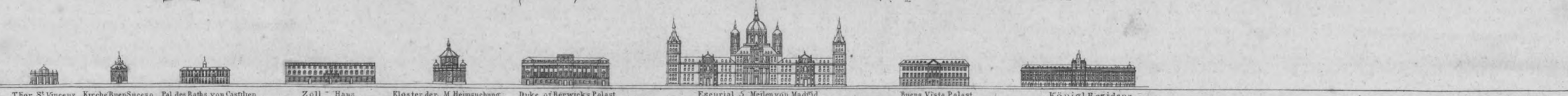
T. Bor. St. Vincent Kirche Buen Suceso Pal. des Raths von Castilien Z. 011 Haus Kloster der M. Heimsuchung Duke of Berwick's Palast Estorial 5 Meilen von Madrid Buras Vista Palast Königl. Residenz

Grössen-Vergleichung der vornehmsten Gebäude in und um Madrid.