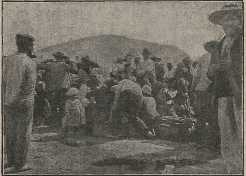
Emigrantes alojados en el tinglado del muelle de Heredia.

propaga rápidamente por toda la Península, sin que la apatía de los que deben evitarla estudie el medio más á propósito para conseguirlo. La campiña andaluza, pródiga y hambrienta de producir, se ve abandonada; después se ven los caseríos, y los cortijos de blancas paredes, inundados de sol, quedan aislados y tristes, cercados de campos eriales