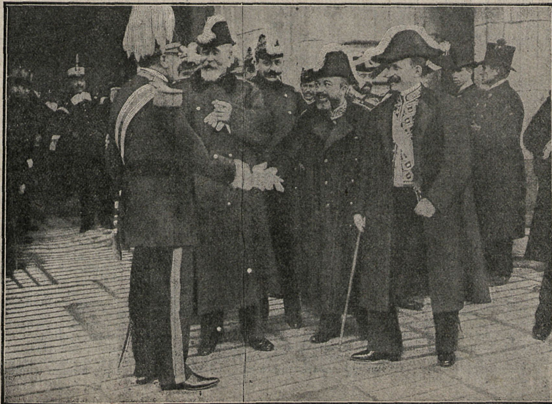
EL GOBIERNO, SALIENDO DE PALACIO