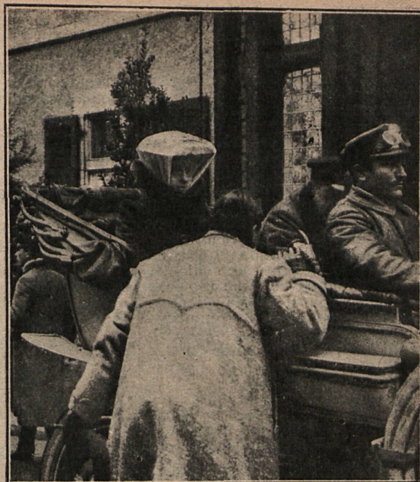
El Rey y las princesas Ena y Beatriz dirigiéndose á San Sebastián.