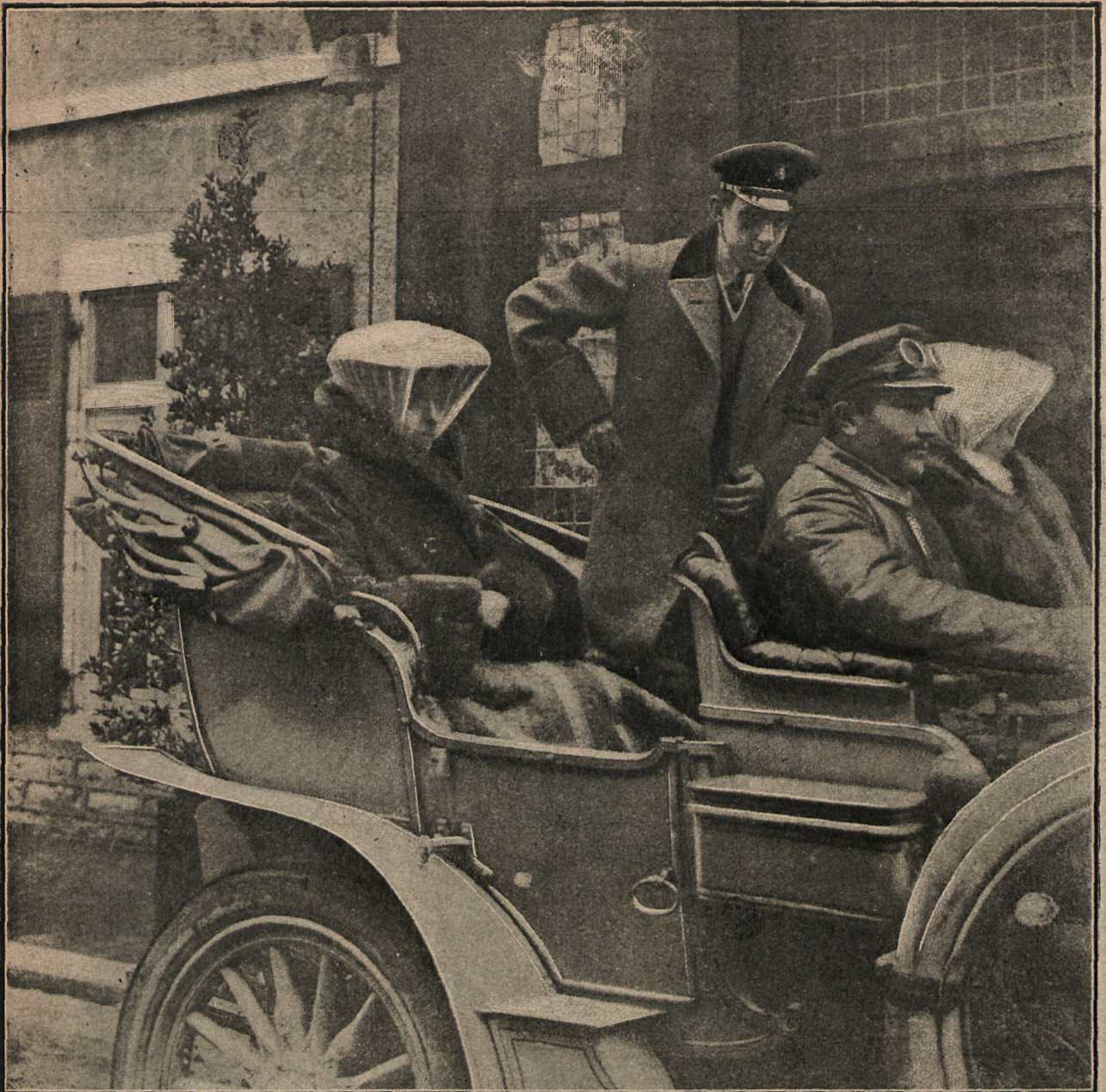
La Princesa Ena de Battenberg, el Rey y la Princesa Beatriz, saliendo del palacio de Mouriscot.

los rasgos de galantería del enamorado Monarca.