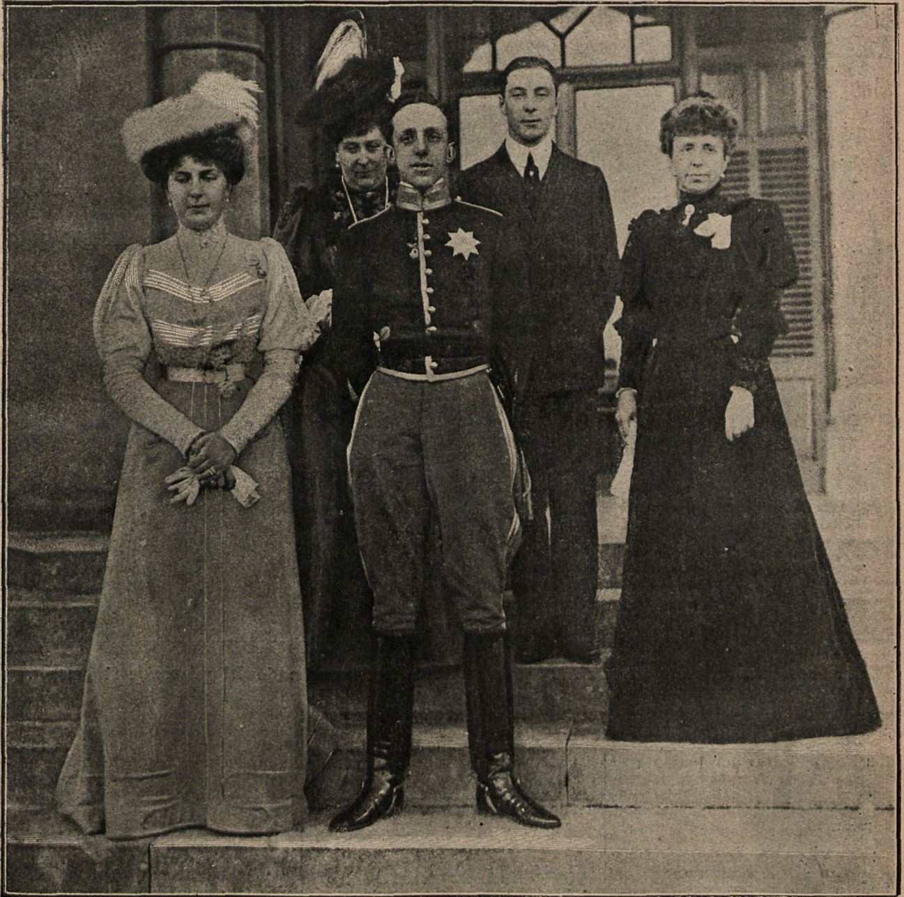
S. M. el Rey y su augusta madre con la Princesa Ena de Battenberg, su madre la Princesa Beatriz y su hermano el Príncipe Alejandro, en Biarritz.

EL REY Y LA PRINCESA DE BATTENBERG EN BIARRITZ