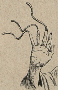
UÑAS DE POLÍTICO

El insigne maestro de nuestros críticos hizo en el artículo insinuaciones graciosísimas respecto á nuestros políticos, alguno de los cuales no tendría bastante con las uñas de las manos y los pies para colocar en ellos el busto del jefe del grupo á que han pertenecido. Pues bien; esa supuesta