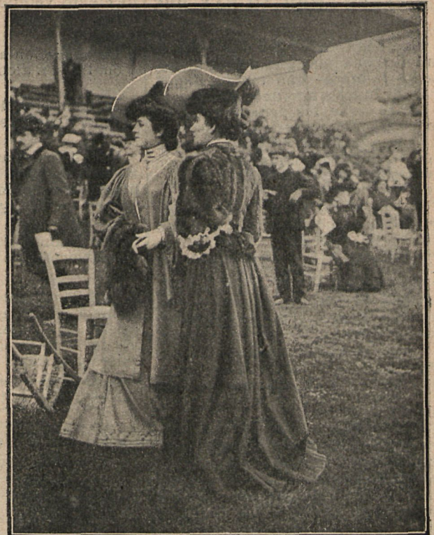
Modelo de traje, hechura sastre, en paño gris, chaleco blanco, bordado, boa y manguito de piel. Abrigos imperio, de paño color perla, con aplicaciones de terciopelo azul y blusa de pieles.