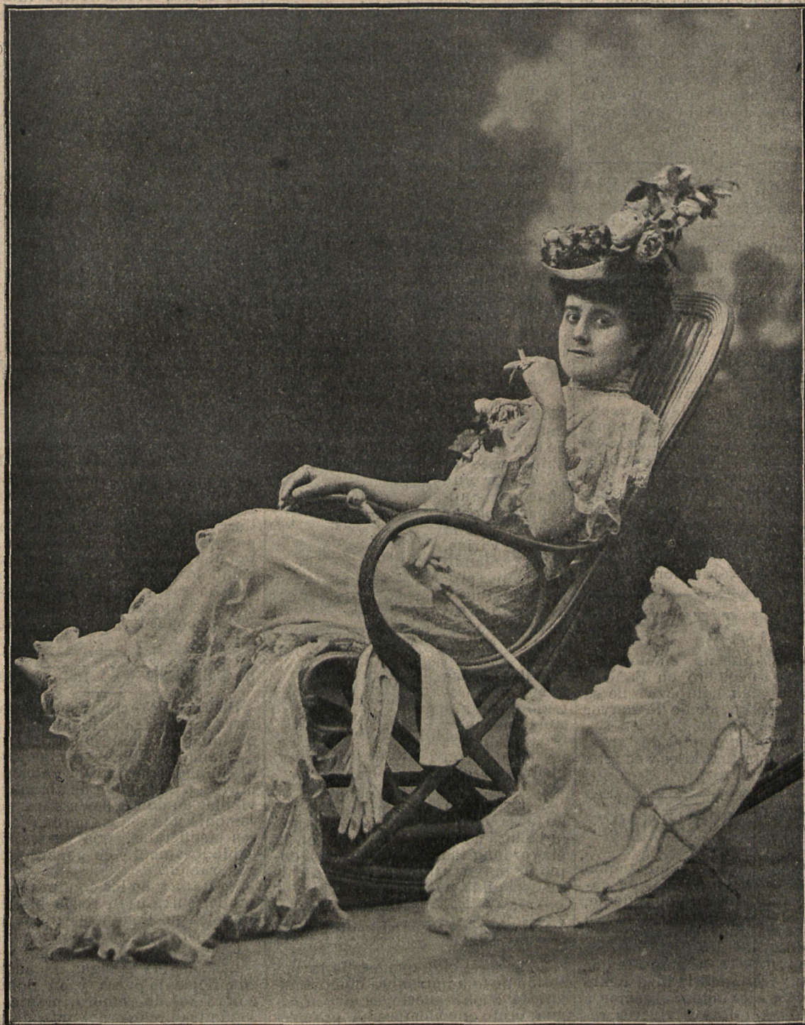
La eminente primera actriz del teatro de la Comedia, Rosario Pino, en la obra «Safo», estrenada anoche.