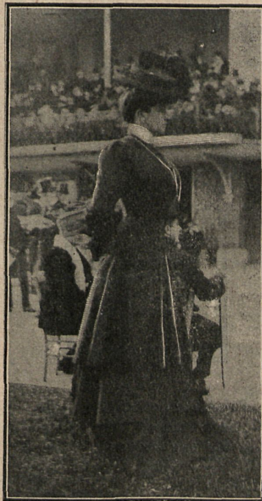
Traje de levita, hech urasastre, en paño mordoré.

jo... bien que todos los madrileños nos hemos enterado perfectamente sin nece-