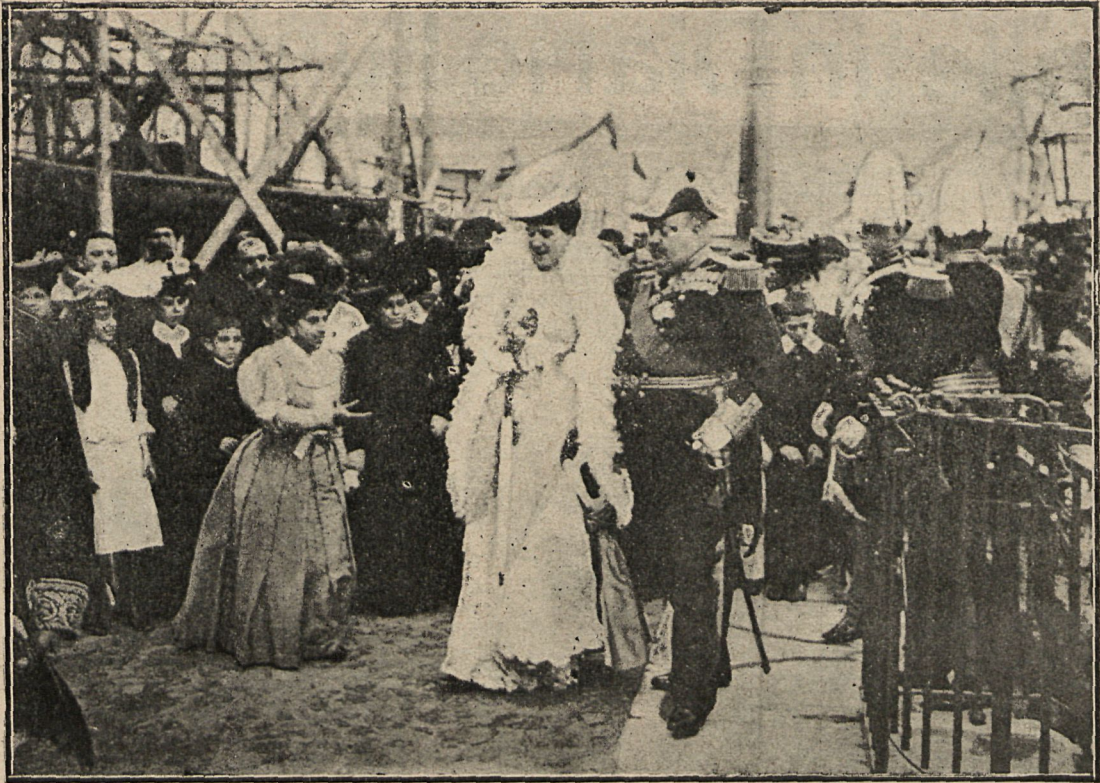
SS. MM. el Rey Carlos y la Reina Amelia asistiendo en Lisboa á un acto oficial. ☐