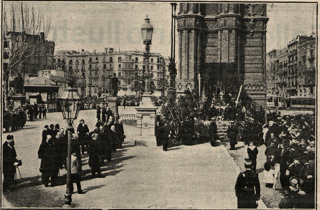
Las autoridades civiles y militares oyendo la misa de campaña que se dijo en el altar emplazado en el Ar.º del Triunfo.