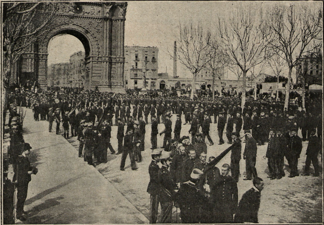
Los nuevos reclutas prestando el juramento.