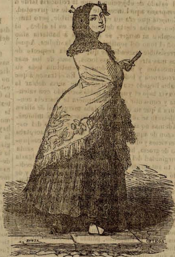
LA HIJA DE SANTIAGO.