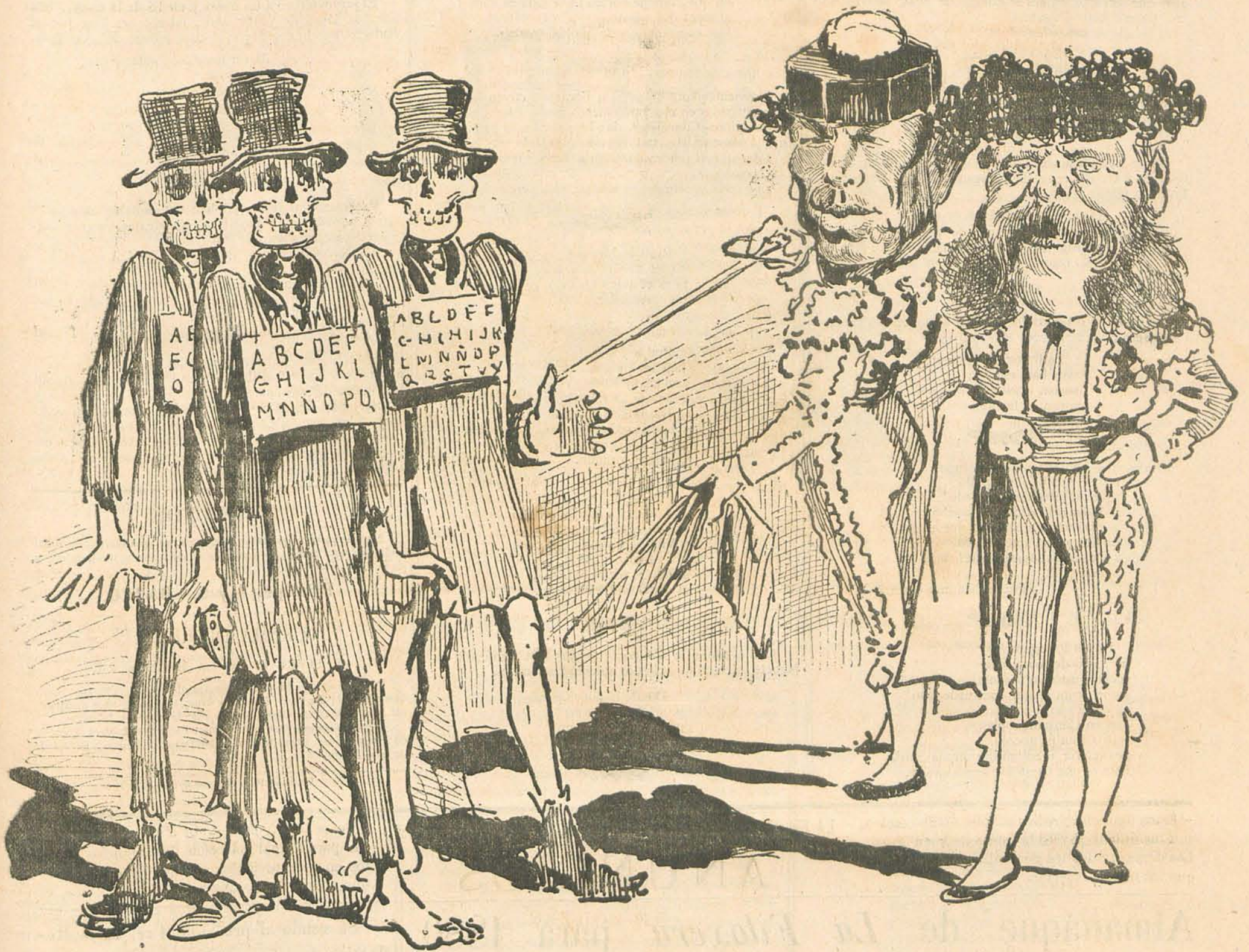
Saldo de cuentas.....

A un pobre hojalatero, ó calderero, que iba á campo traviesa entre rastros le salieron dos hombres; quitáronle el dinero, y una venda poniéndole en los ojos, dejáronle con otra atado á un pino llorando amargamente su destino. También yo tuve de llorar antojos al leer el quid pro quo ; mas, en los nombres, ví que hay que creer el lance del viajero (aunque alguno se ofenda) natural accidente del camino, pues fué en el idem de Llorona á Benda. «Si fueres algun día hojalatero, ten presente, lector, esta leyenda, y, si amas tu persona, no vayas solo á Benda ni á Llorona.