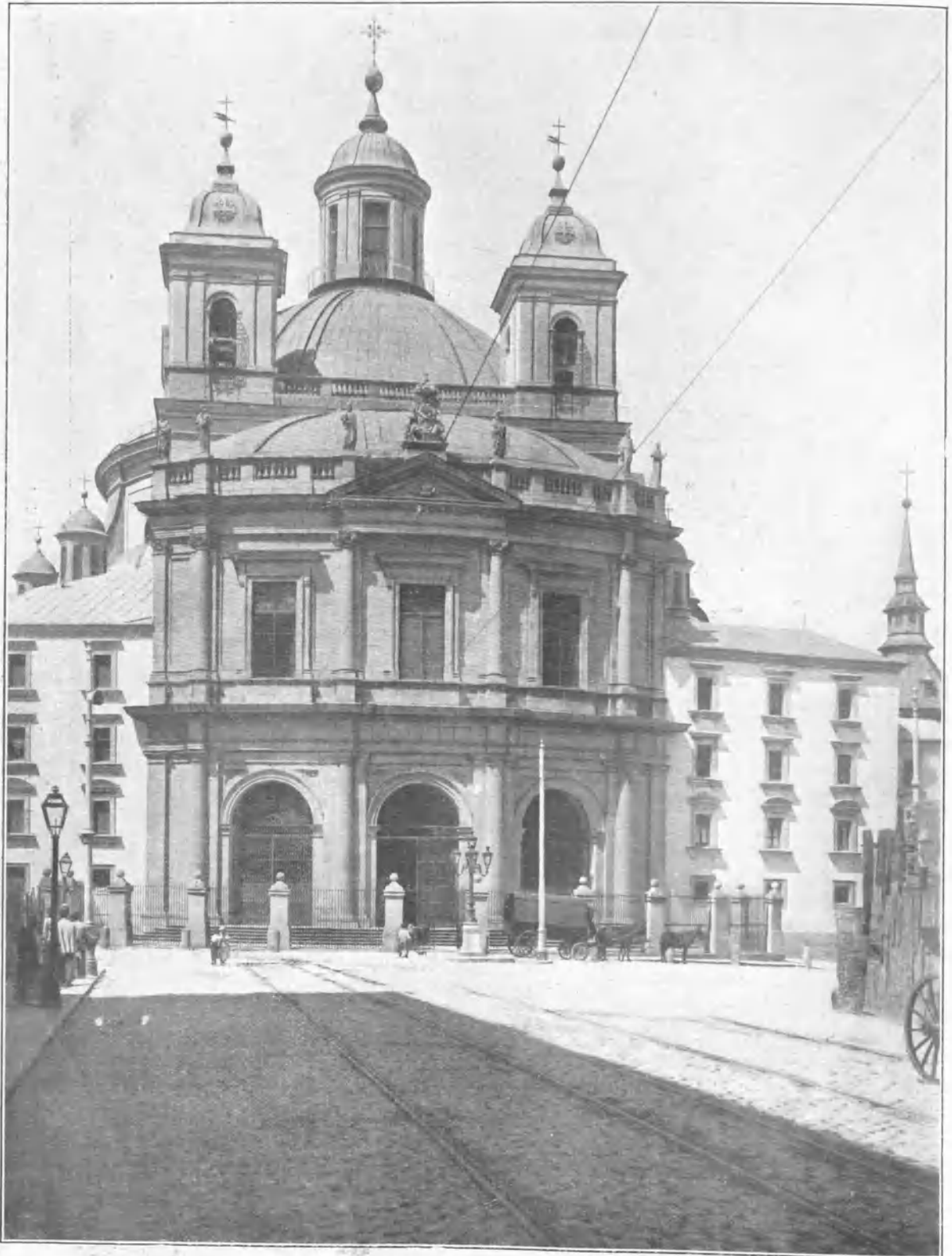
IGLESIA DE SAN FRANCISCO EL GRANDE (MADRID)