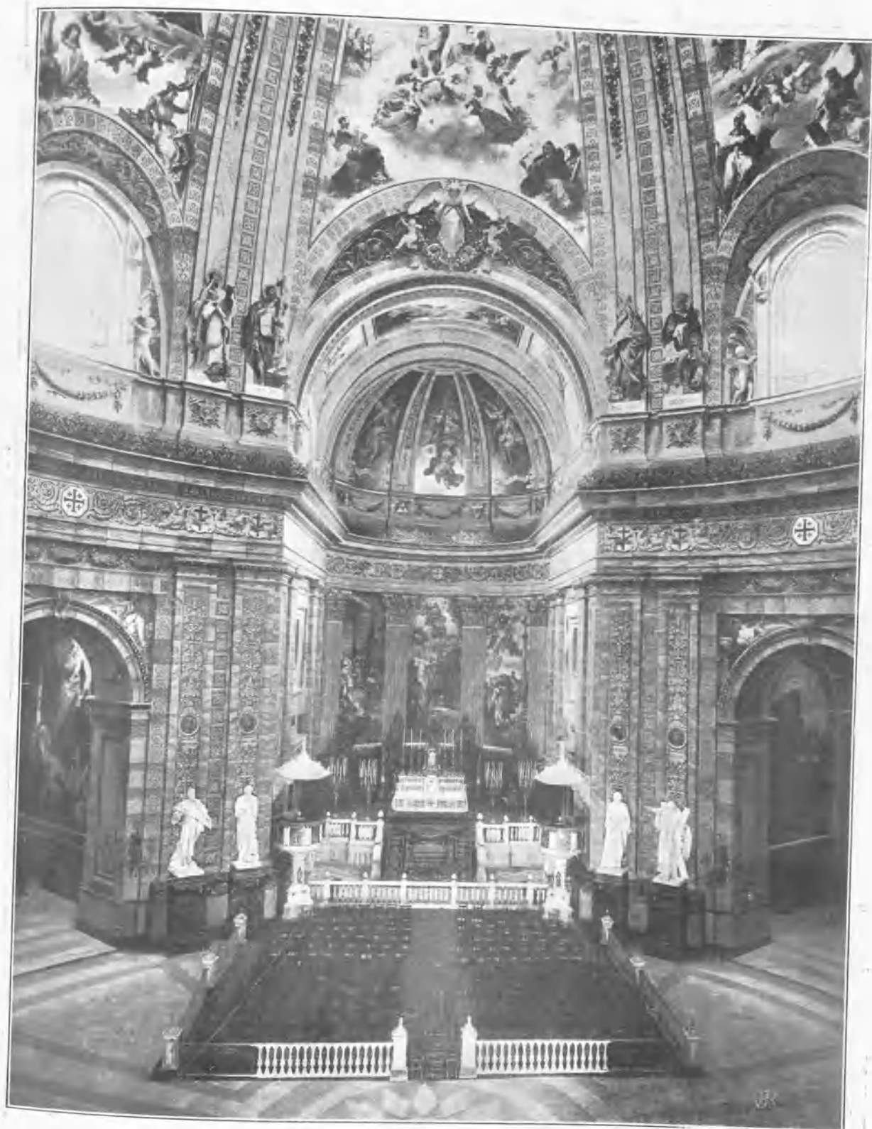
ALTAR MAYOR DE SAN FRANCISCO EL GRANDE (MADRID)