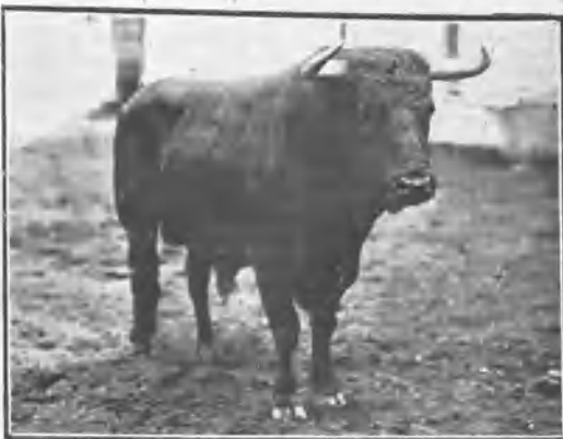
ESCARAPELO, DE MURUVE, NEGRO