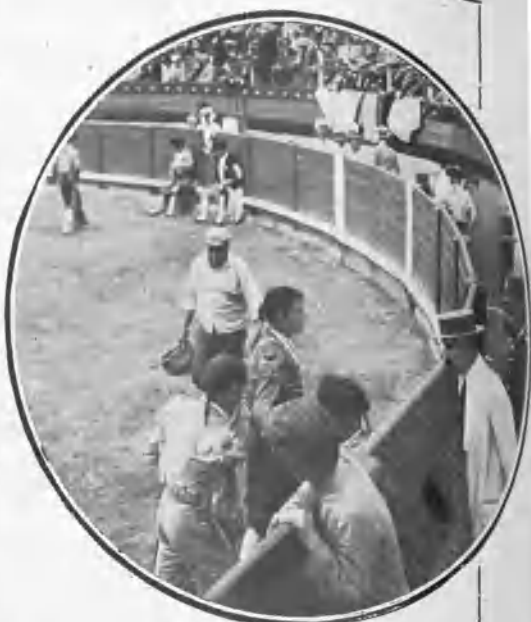
PALMA DE MALLORCA. ALGABEÑO II DESPUÉS DE LA MUERTE DEL SEGUNDO TORO

Algabeño II no tuvo gran fortuna, y momentos hubo en los que escuchó más pitos de los que hubiera deseado.