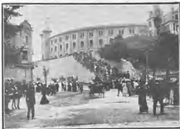
SAN SEBASTIÁN. SUBIDA Á LA PLAZA

Las corridas transeurren sin novedad generalmente, y aunque no falta quien ve defectos y aprecia y aquilata méritos, casi todo se aplaude y se jalea casi todo por nuestros simpáticos vecinos, que, como están en mayoría, imponen su gusto, más próximo á la blandura que á