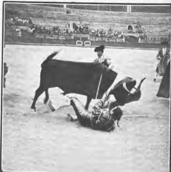
MURCIA. CAIDA DE CORTIJANO AL MATAR Á SU SEGUNDO TORO