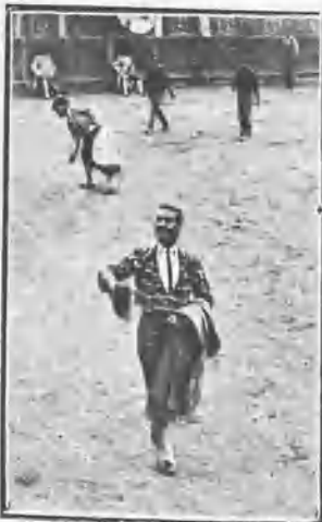
OVACIÓN Á BIENVENIDA POR LA MUERTE DE SU SEGUNDO TORO