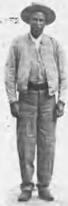
MAYORAL DE MORENO SANTAMARÍA

lest, y se concederá un premio de 5.000 pesetas al ganadero á quien pertenezca el toro que mejor pelea haga.