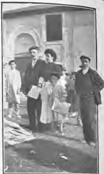
SANTANDER. VENTA DE ALMOHADILLAS

Durante la corrida, alegría sin límites, comida á todo trapo y bebida á discreción. Los lances de la lidia se juzgan con distintos criterios, abundando el benévolo, y al pedir banderillas á los matadores (detalle del que jamás se prescinde), es obligación ineludible parrear con palos lujosos. Inútilmente los