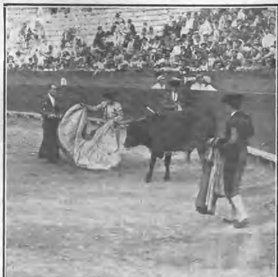
VALENCIA. EL CHICO DE CAMILA EN SU SEGUNDO TORO