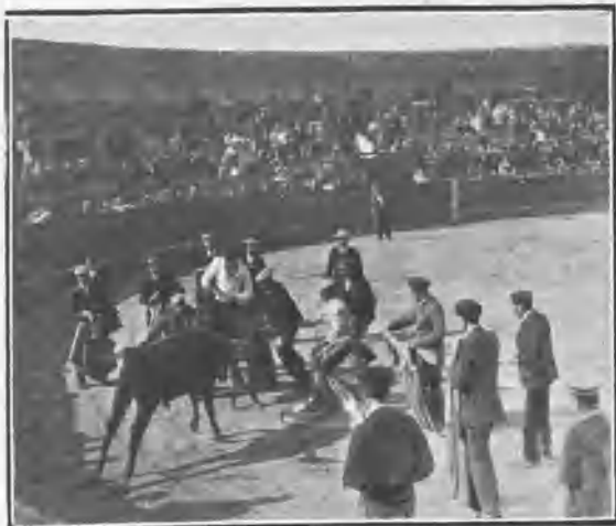
TETUÁN. BECERRADA DE LOS EMPLEADOS DE LA PLAZA DE TOROS