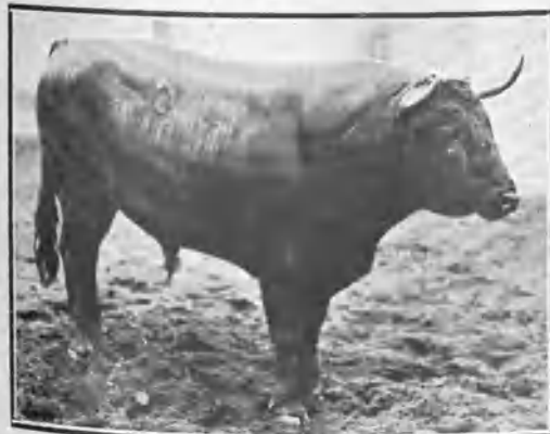
ENCARNADITO, DE SANTA COLOMA

Para ello se ha nombrado un competente Jurado, cuyo dictamen se acatará. Hay, además, apuestas mutuas, como las hubo en la segunda corrida organizada en esta corte por la Asociación de la Prensa. Oportunamente daremos el resultado de esta corrida.