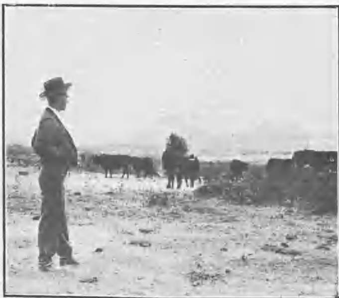
MACHAQUITO VIENDO LOS TOROS PARA LA CORRIDA DE LOGROÑO