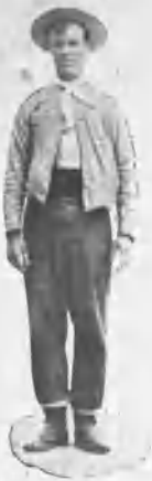
MAYORAL DE GUADALEST