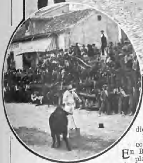
UN MOMENTO INTERESANTE DE LA CAPEA

En Arganda hubo el lunes capea. Con este motivo fueron allá numerosos aficionados de Madrid y de varios pueblos de la provincia. Dirigió la lidia Machaquito de Madrid , y á la plaza del pueblo donde se dió la fiesta salieron veinte novillejos que dieron bastante juego, pues todos resultaron bravuconcillos.