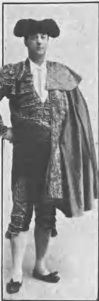
LUIS MAZZANTINI

nene) que murió la víspera de la corrida.