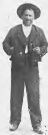
MAYORAL DE MURUVE

Para el domingo último estaba anunciada en San Sebastián una corrida que parece se celebrará el jueves próximo, pues hubo que suspenderla á consecuencia de la lluvia. Esta corrida ha despertado mucho interés, porque tiene el carácter de concurso, y en ella han de lidiarse seis toros, de seis ganaderías distintas, cuyas fotografías acompañan á estas líneas. Son las reses de Miura, Pablo Romero, Moreno Santamaría, Santa Coloma, Muruve y Guada-