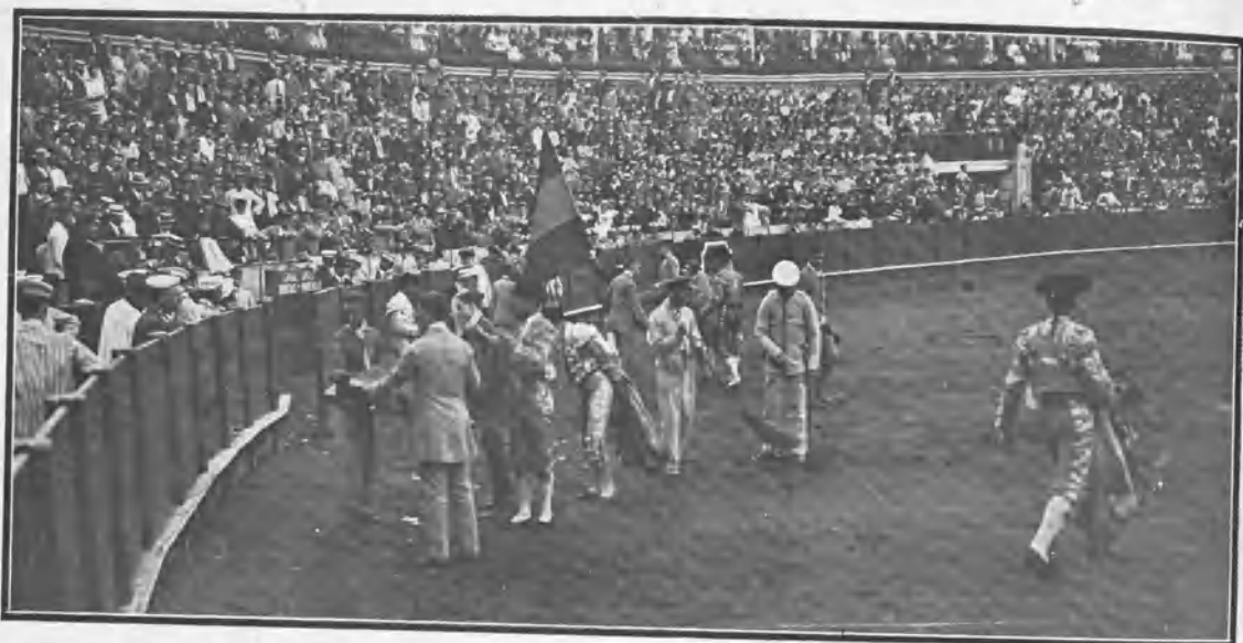
SEVILLA. LOS ESTUDIANTES EN UNIÓN DE LAS CUADRILLAS PIDIENDO PARA LAS FAMILIAS DE LOS RESERVISTAS