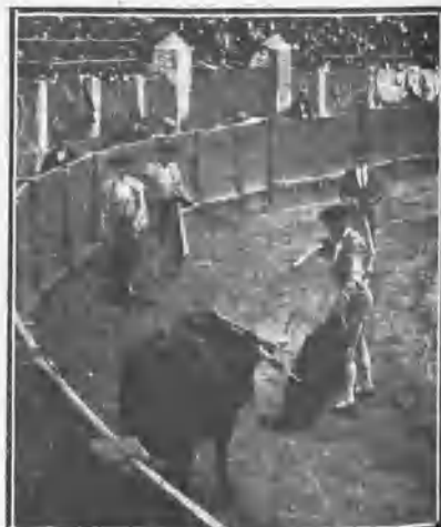
COCHERITO EN SU SEGUNDO PENSILANDOSE PARA MATAR