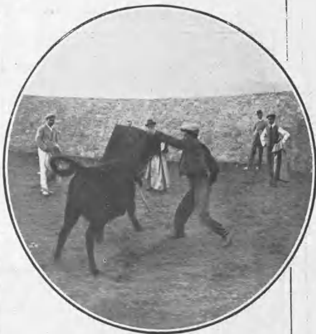
UN PASE DE PECHO DE MACHAQUITO

lencia, corrió y capoteó con valentía el ganadero, y el joven revistero Corinto y Oro , al dar unos pases por bajo, rodó, y si no dejó el oro por la arena de la plaza, el corinto quedó por los suelos; pero dejó á salvo la dignidad revisteril.