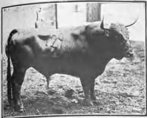
BOMBITO, DE MIURA, CASTAÑO