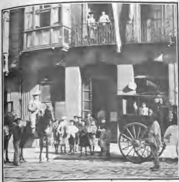
BILBAO. CASA DE AJURIA

es como hablar de Madrid, así en lo que se refiere á la plaza (muy parecida á la de la Corte), como en lo que atañe al público, entre el que figura la plana mayor de la buena afición madrileña.