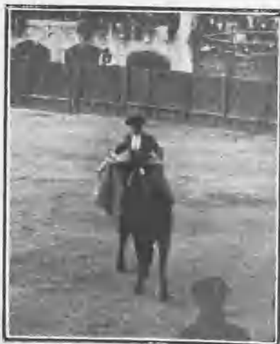
BIENVENIDA EN UN QUITA EN SU SEGUNDO TORO