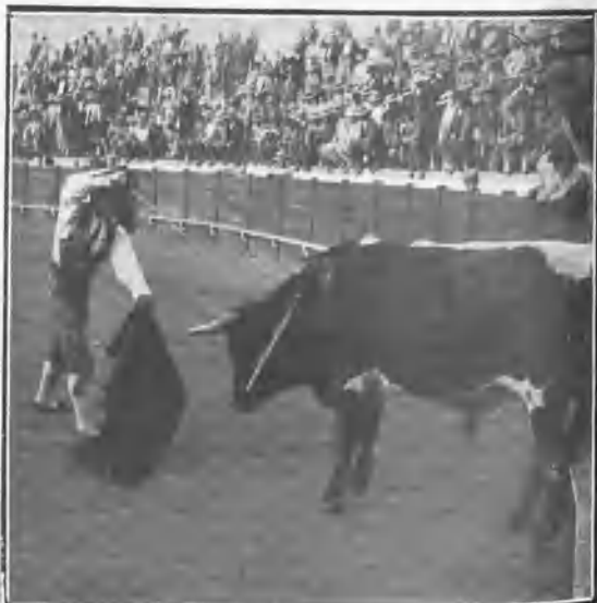
CANTILLANA. CHICUELO II EN SU PRIMER TORO