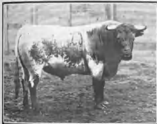
TIJERO, DE PABLO ROMERO BERRENDO EN CÁRDENO

Para el domingo último estaba anunciada en San Sebastián una corrida que parece se celebrará el jueves próximo, pues hubo que suspenderla á consecuencia de la lluvia. Esta corrida ha despertado mucho interés, porque tiene el carácter de concurso, y en ella han de lidiarse seis toros, de seis ganaderías distintas, cuyas fotografías acompañan á estas líneas. Son las reses de Miura, Pablo Romero, Moreno Santamaría, Santa Coloma, Muruve y Guada-