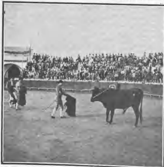
CANTILLANA. FRASCUELITO PASANDO DE MULETA A SU PRIMER TORO

Esta costumbre de echarse al redondel que en casi todas las plazas de toros existe, es de las más lamentables, y algún día dará origen a desgracias muy sensibles.