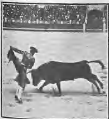
MALLA TOREANDO DE CAPA.

En los lances de capa estiró los brazos algo más de lo que acostumbra, y con la muleta no ha encontrado todavía la forma de dejar de ser codillero. Casi siempre está bien colocado con el capote, y en resumen, hay en este muchacho más cosas que en todos los que han salido en las dos últimas temporadas.