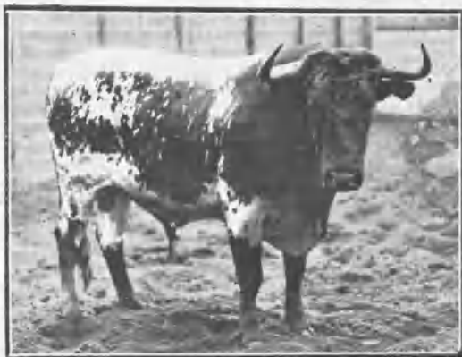
CARPINTERO, DE MORENO SANTAMARÍA BERRENDO EN NEGRO