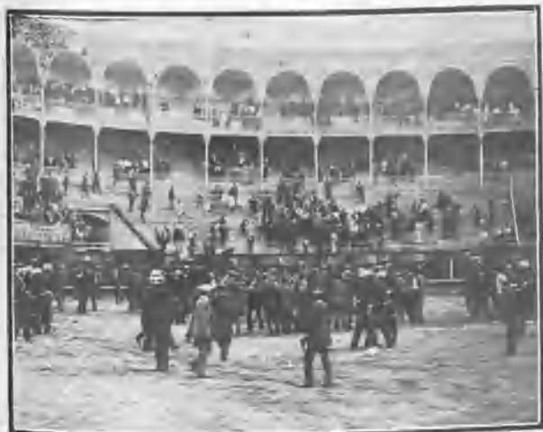
SAN SEBASTIÁN FINAL DE LA CORRIDA. LA JOTA

Las limitaciones de un artículo no permiten más, aunque mucho pudiera contarse verdaderamente sui generis .