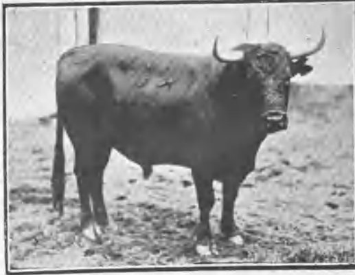
MERINO, DE GUADALEST, NEGRO