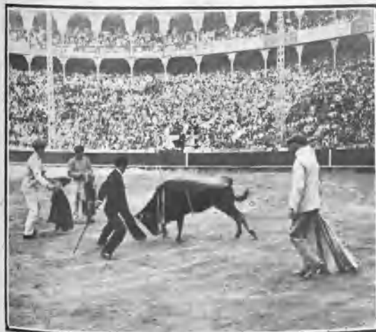
BARCELONA. BECERRADA Á BENEFICIO DE LOS PELUQUEROS