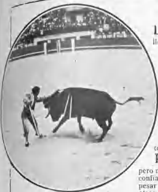
PACOMIO PASANDO DE MULETA

una lluvia pertinaz, se decidió a acabar pronto y dió un metisaca bajo que silbó la multitud justamente.