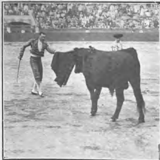
VALENCIA. SEGURITA DE VALENCIA EN SU PRIMER TORO

Resultado: que no se organizarán muchas fiestas semejantes en la plaza valenciana.