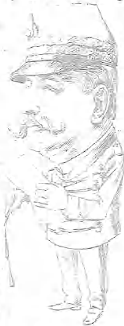
El general Dabón.

res que dan saltos mortales ó de actrices que enseñan las piernas, el gas calló. Alguna protesta tuvo contra su alejamiento de ciertos coliseos, pero el enojo subió de tono al saber el gas que en un teatro de Madrid representaba comedias la Duse. Por supuesto, que el gas no tiene patriotismo ninguno. Porque por muy eminente actriz que sea Eleonora Duse, ella al cabo no es española, y aquí lo urgente es que se salven las actrices españolas, aunque perezcan las buenas comedias.