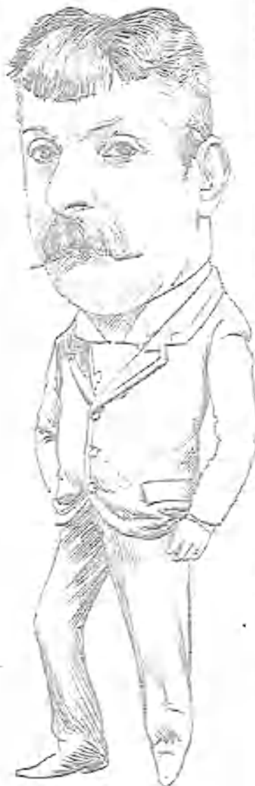
Cab. Flabio Andó.