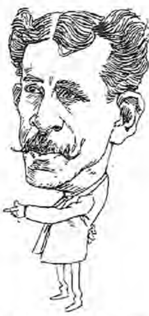
EL ILUSIONISTA AYCARD

vide, y dije: «pues ya sé á qué la voy á destinar. La haré lo que era aquel huésped modrego que estaba en casa, cuando usted.»