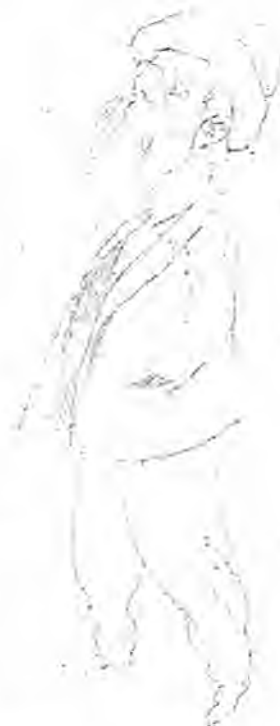
Va siguiendo á mi esposa. ¡Valiente facha! Como la haga una muñeca le rompo el alma.