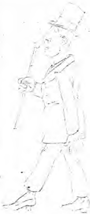
Voy siguiendo los pasos de Dorotea. ¡Se va á volver locuiza cuando me vea!