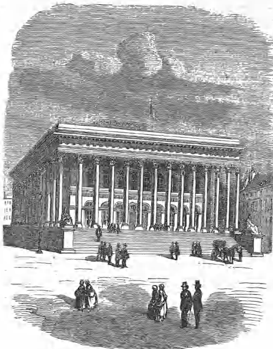
PALACIO DE LA BOLSA EN PARÍS.

París reclamaba un edificio digno para las reuniones de los negociantes, que se verificaban antes de la revolución de 1789 en el Hôtel-Mazarino, y que pasaron luego á formarse en la iglesia de los padres menores (1) y después al palacio real. Napoleón fué quien proyectó la construcción de un edificio para la Bolsa, tal cual lo exigía la grandeza de la Francia entonces, y el objeto á que se destinaba. Empezóse en 1808, y se concluyó en 1826.