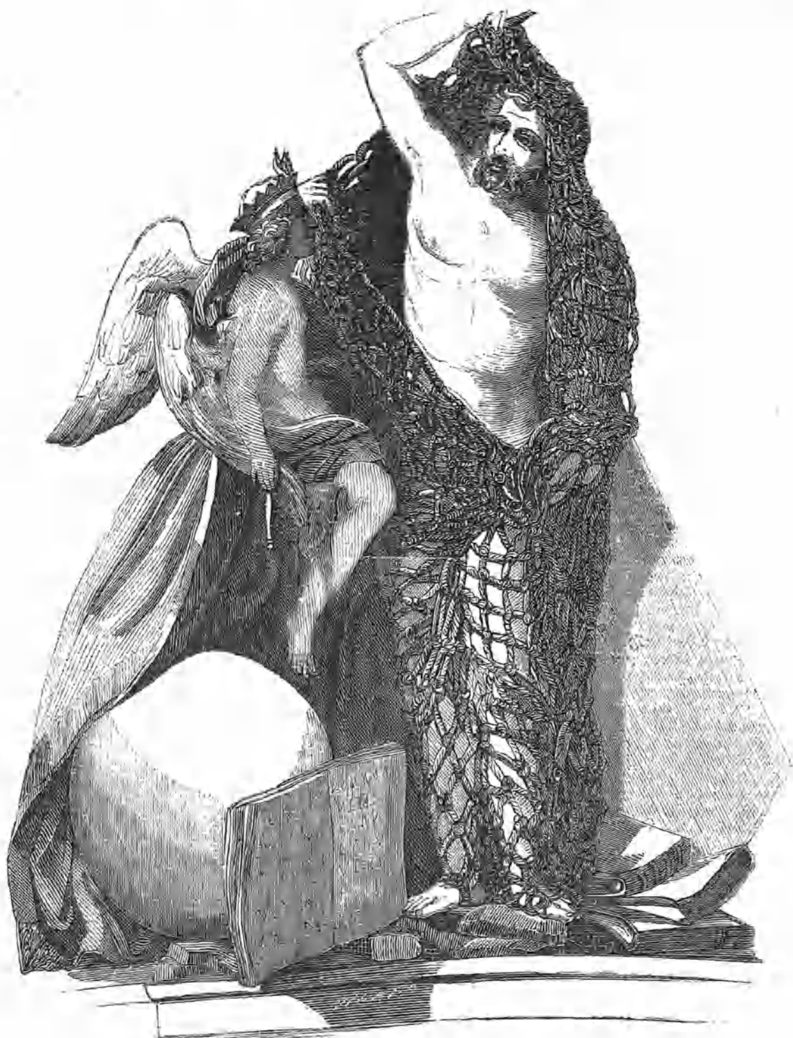
LA CAPILLA DE SAN SEVERO EN NÁPOLES.