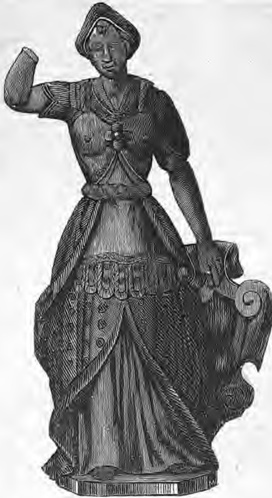
(Estatua romana de Caldas.)