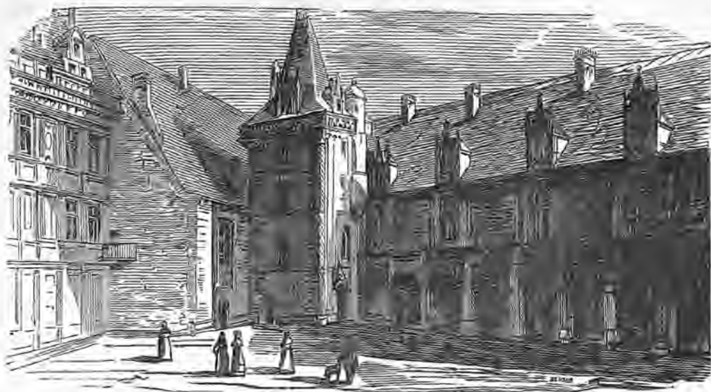
Castillo de Blois, departamento de Loir-et-Cher.

Se cree generalmente que este edificio ha sido elevado en tiempo de los reyes de la primera raza y sobre los restos de un fuerte construido por los romanos.