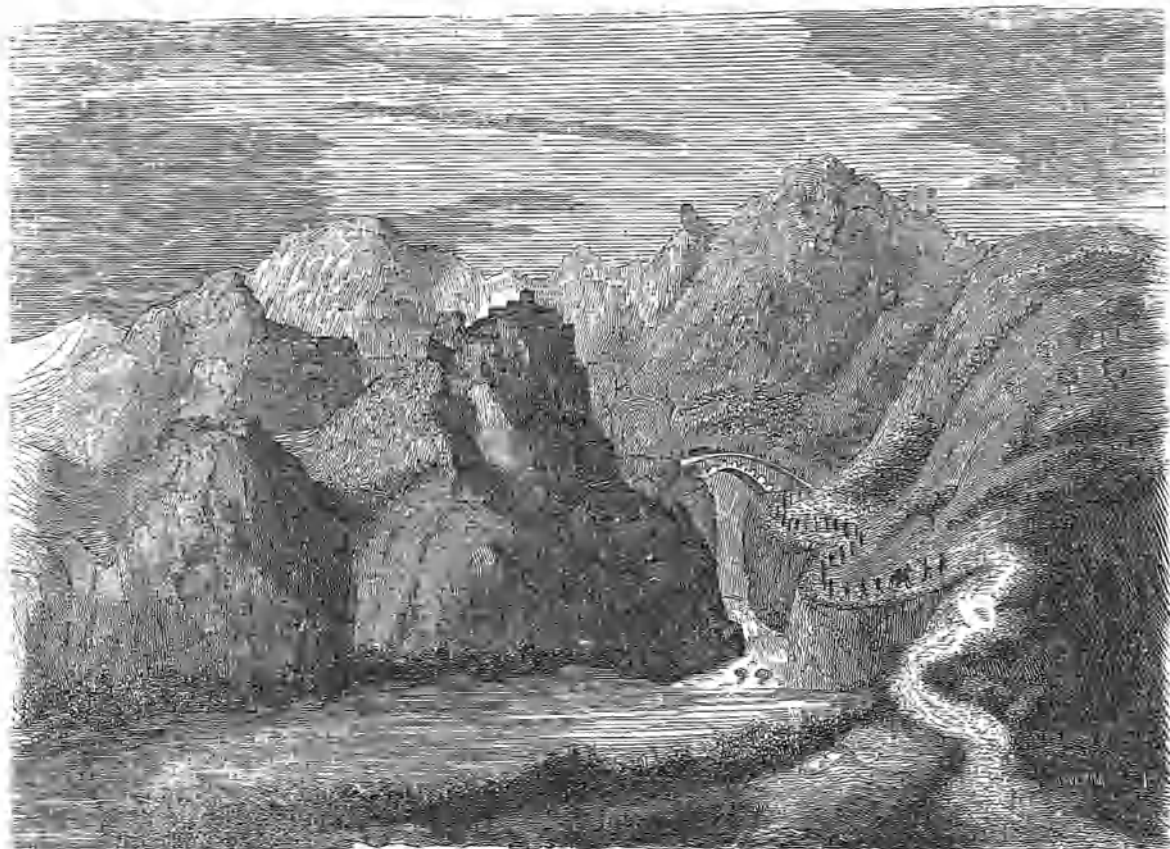
EL PUENTE DE OCINOS.

Entre los parajes más pintorescos y notables por su naturaleza, que encierra nuestra Península, merece un lugar la caprichosa garganta que se encuentra en las inmediaciones de Burgos, cortada por el puente llamado de los Ocinos, y la puerta de la Orodada. La lámina que presentamos, da una idea completa de la extraña perspectiva que ofrece esta angostura.