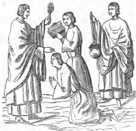
Apuntes para la historia de los trajes de España en los siglos XII, XIII, XIV, XV y siguientes.