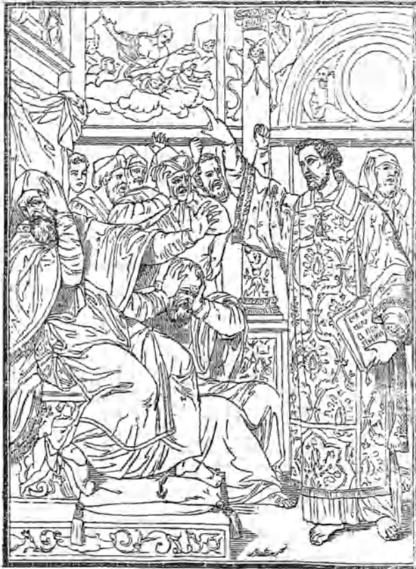
St. Estevan acusado de blasfemo ante la sinagoga. — Cuadro de Juan de Juanes. (1)

No es este el verdadero nombre y apellido del autor de esta preciosa tabla. Antes de describirla debe deshacerse el error en que incurrieron los biógrafos