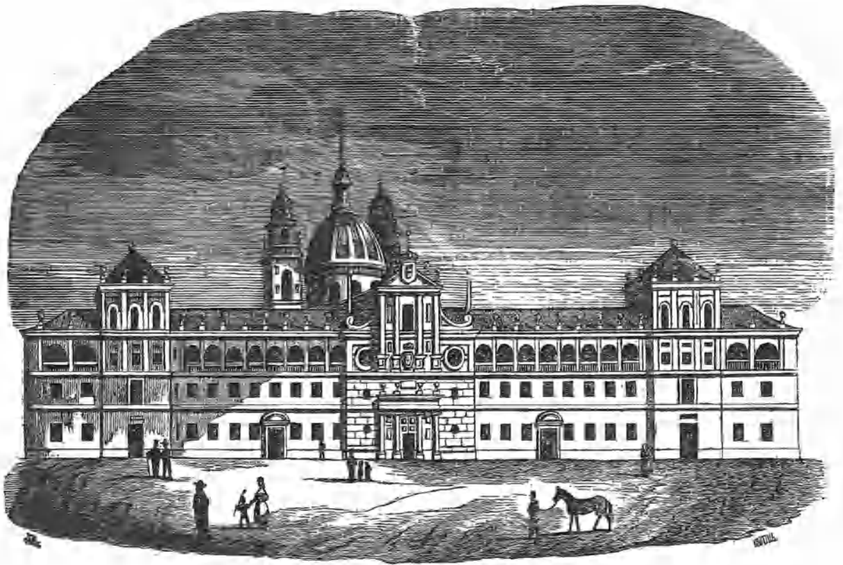
Colegio de Humanidades en Monforte de Galicia.

Entre los monumentos que nos recuerdan con gloria los tiempos ilustrados de la España moderna, debe contarse el Colegio de Monforte en Galicia.