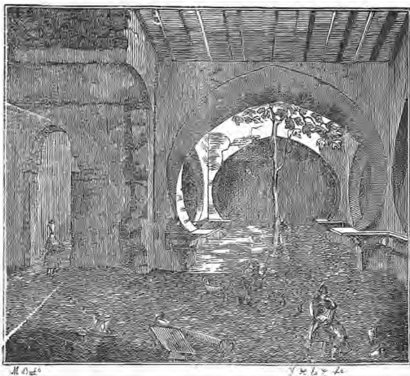
Subterráneo de la Casa de baños, edificada por el Rey de Murcia Abrahén Ezeandari (1).

En la primera estancia ya descrita, todo mostraba un día claro, una atmósfera serena, porque nos encontrábamos mas cerca de la region, donde el sol dorra con sus rayos las paredes, pero en este sitio al que paso á paso, nos ha conducido en descenso una escalera prolongada, pero muy angosta, solo un escape de luz que penetra en el seno del cuadro que representa la estampa que esta al frente, es el único rastro de luz que, debida á un hundimiento, alumbrá la estancia subterránea. El horizonte se pierde en tinieblas; y dirá el lector cómo un edificio que fue destinado á gozar, los musulmanes que fueron tan completos en el modo de conseguirlo le privaron de este atrac-