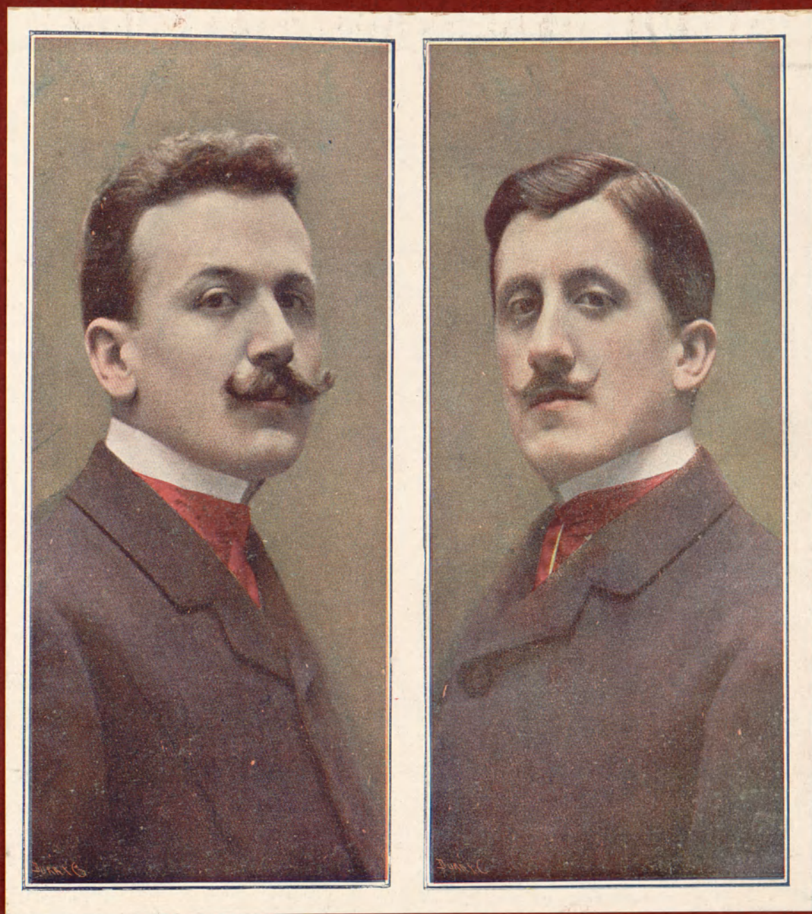
Serafín Álvarez Quintero