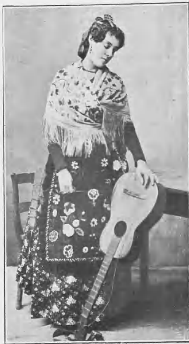
Luisa Martínez Casado en „La Dolores”.

Romea, Ricardo Zamacois, Ramón Rosell, Escriú, Calvo, Vico y otros grandes actores.