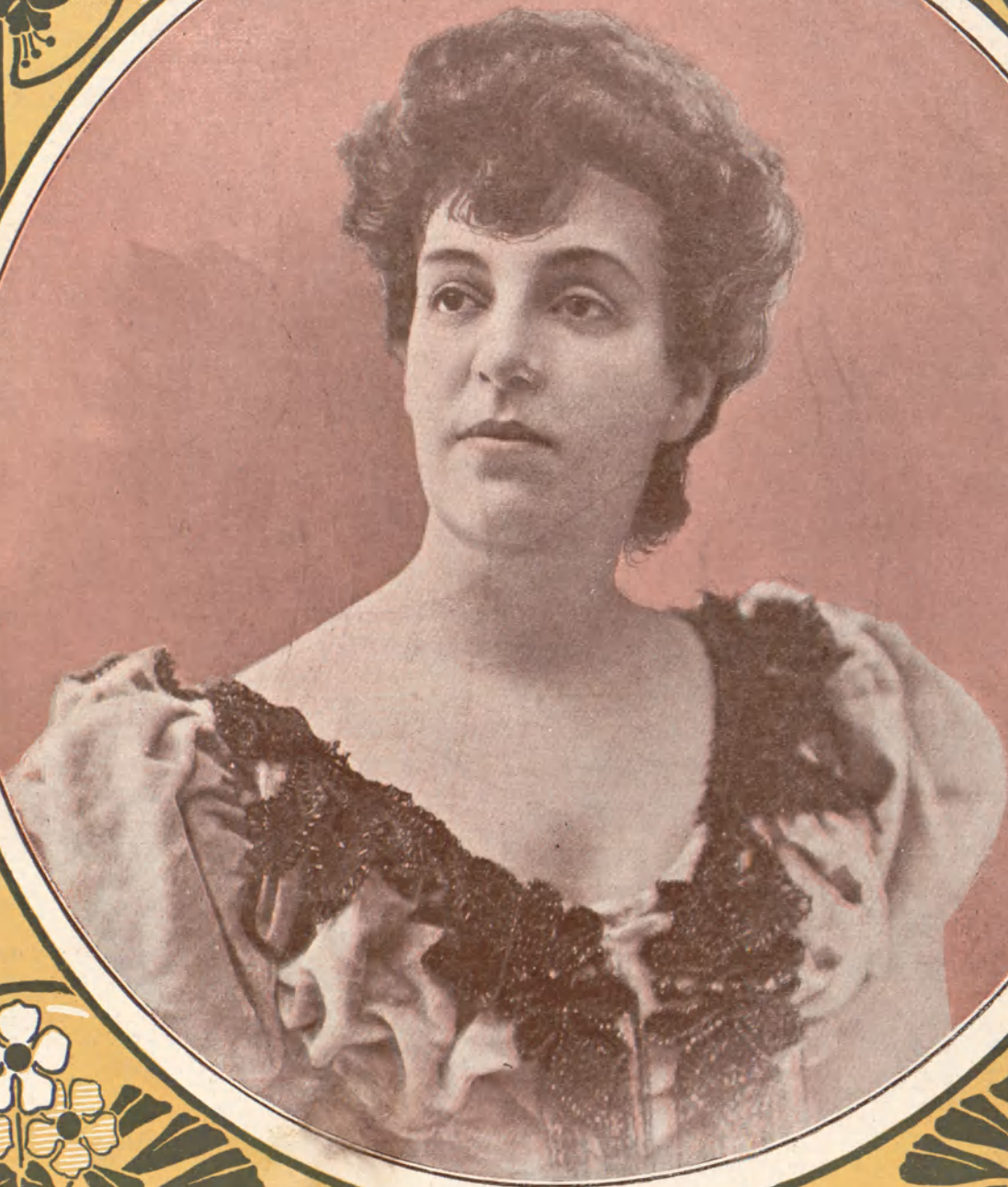
LUISA MARTÍNEZ CASADO eminente actriz española que actúa con gran éxito en América.