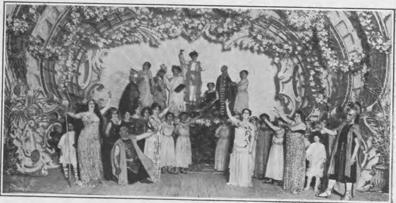
Escena final de la obra.

Para que nuestros lectores puedan formar idea del lujo con que la obra ha sido representada, publicamos en esta información algunas de las escenas más culminantes de los cuadros tercero y cuarto, que son los más sugestivos y pintorescos.