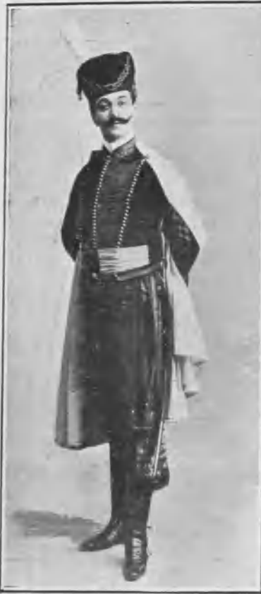
En „El húsar de la guardia”.