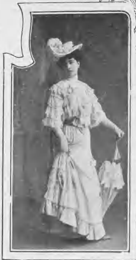
En „El dúo de la africana“.

hace año y medio para desempeñar el papel de «Norberta» en la zarzuela Los chicos de la escuela , sin que su début como artista hiciera presumir entonces que en tan corto espacio de tiempo había de convertirse en una tiple de tan excepcionales condiciones.