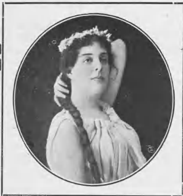
En „Virginia“, de Tamayo.

R AFAEL Calvo, primero, y después las compañías Guerrero-Mendoza y la de Emilio Thuillier, lograron ganar en tierra americana inmarcesibles laureles, llevando al otro lado del mar el moderno espíritu de la dramaturgia española.