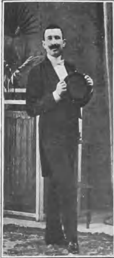
En „La gatita blanca“.