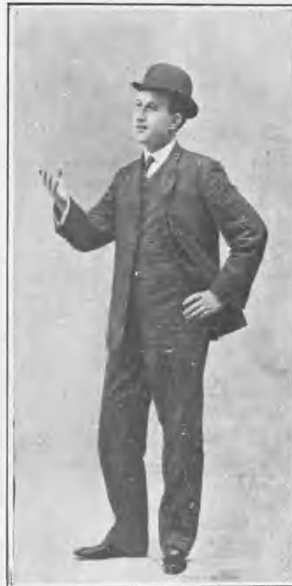
En „El amor en solfa“.