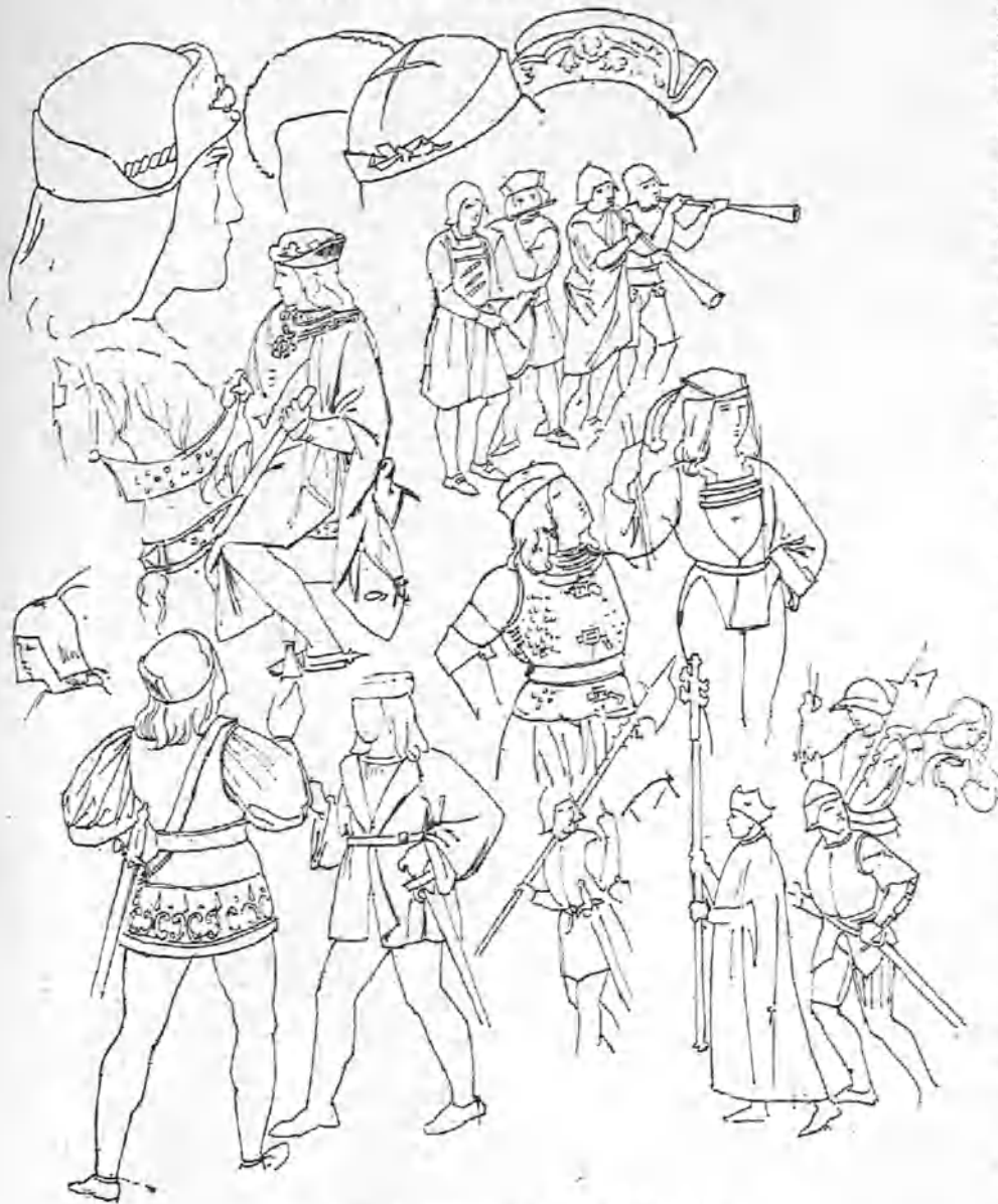
Trajes de la época de D. Gonzalo de Córdoba.

Por lo que de dicha zarzuela hemos oído, nos hace creer que tendrá un éxito tan franco, como Curro Vargas .