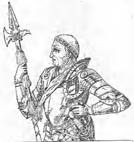
Facsimile de un grabado de la época que representa á Gonzalo de Córdoba.