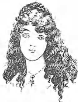
al primo Máximo (tenor lírico)