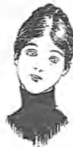
á la beata de su suegra.