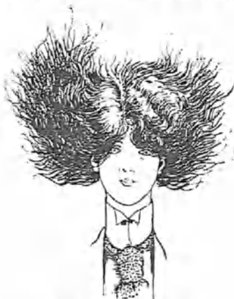
á un pintor modernista,