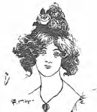
á una enemiga.