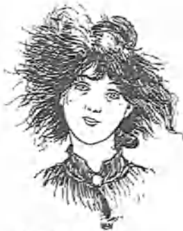
Cuando está en casa.