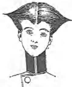
Cuando visita á un subteniente.