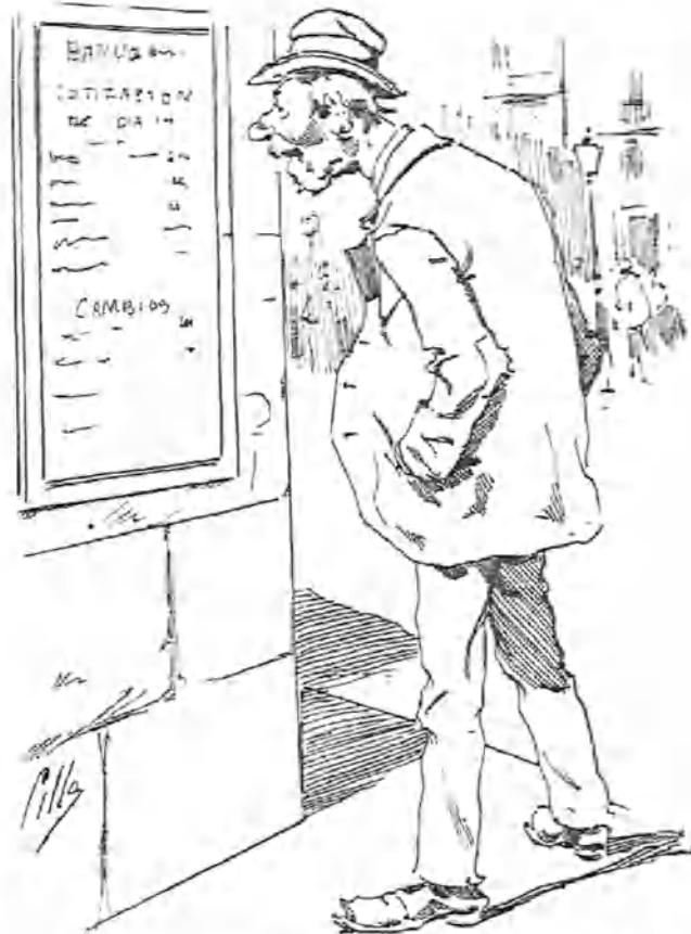
—¡Los francos á 19,40! Tampoco este año puedo ir á Bayona á comprarme un chaleco.