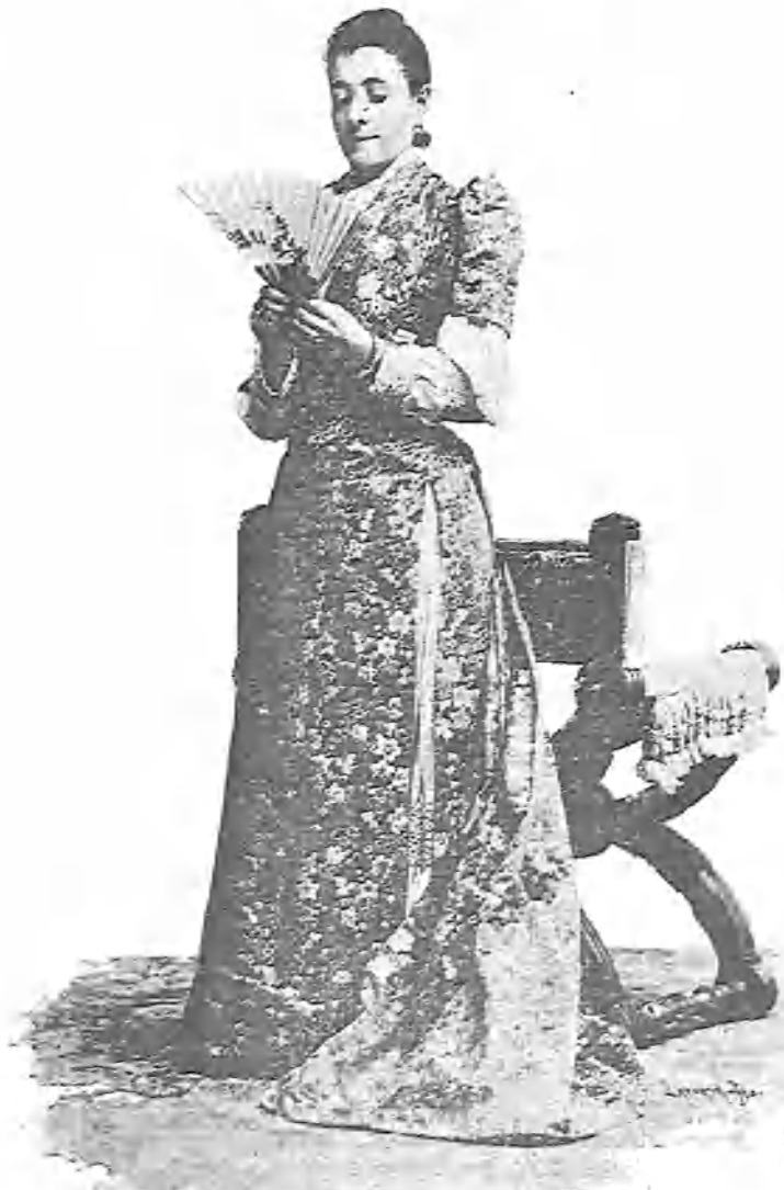
(En la comedia Paris fin de siglo .)