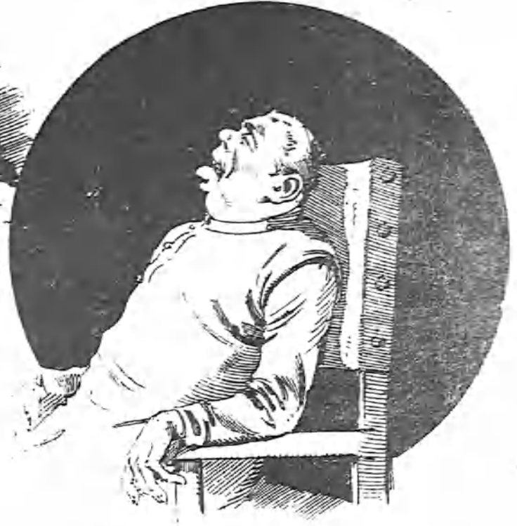
Que en El Molín han sabido lo del jueves.