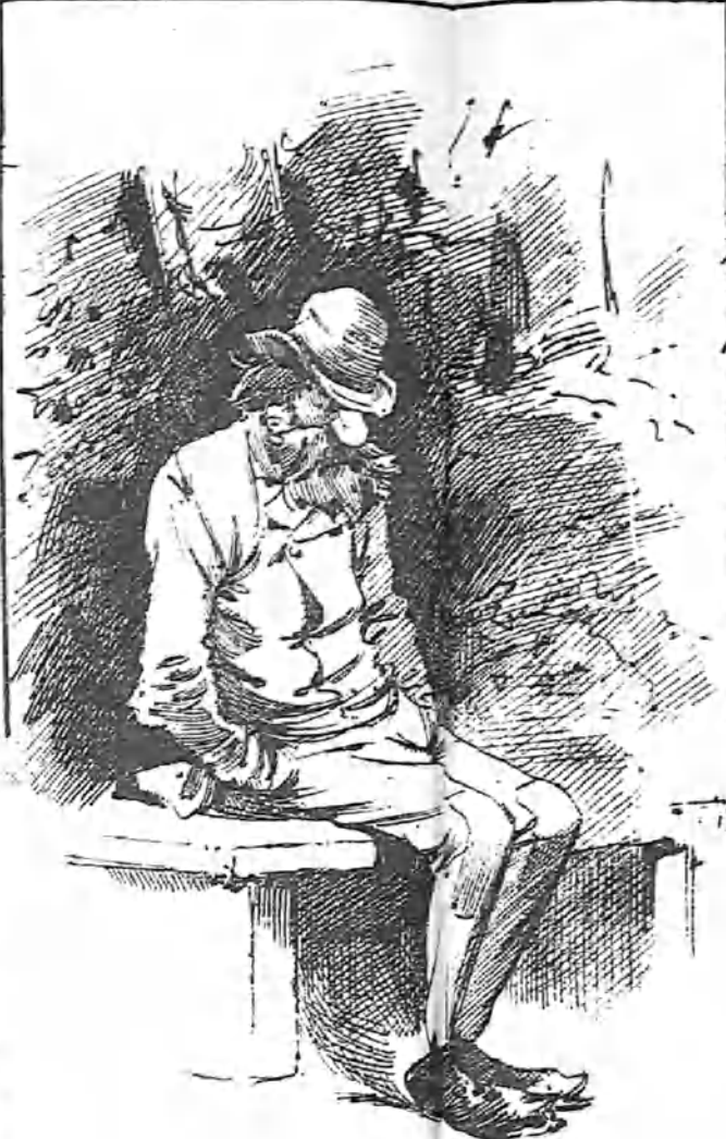
Que le convidan á alubias.