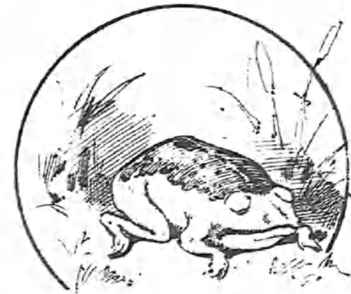
Que no es rana.