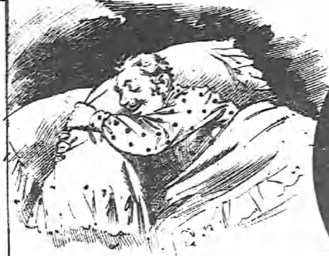
Que la almohada es Fulanita de Tal.