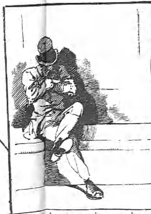
Que le da catorce golpes a un duro.