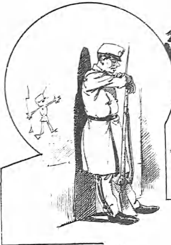
Con el ama de cría correspondiente.