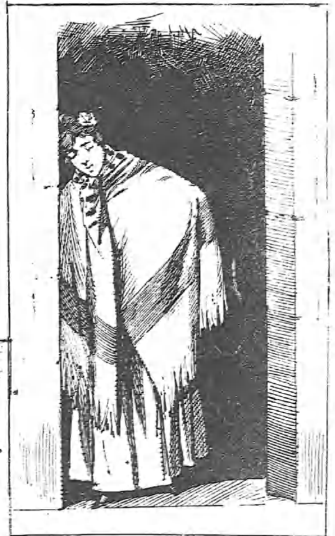
Que viene uno cualquiera.