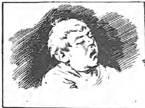
Que los pájaros maman.