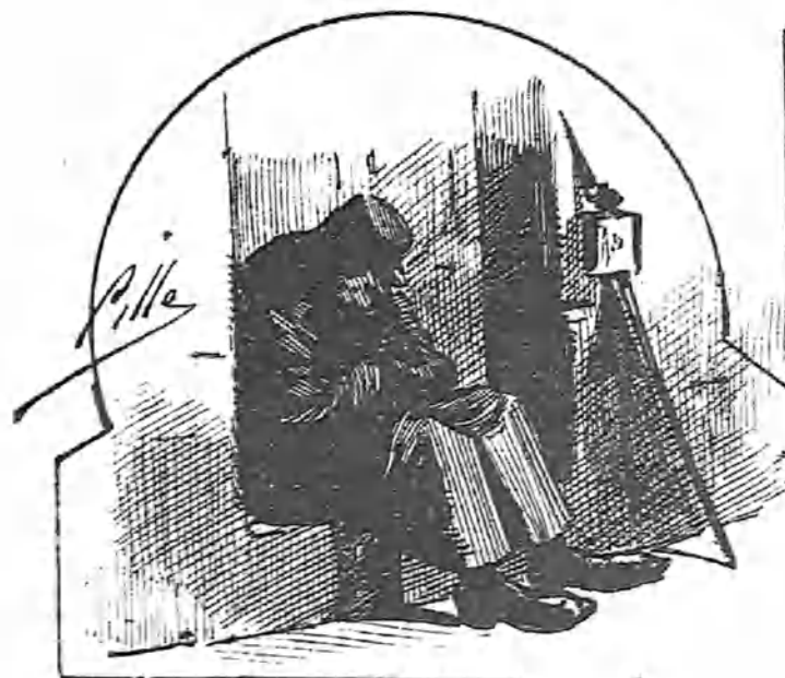
Que está despierto.