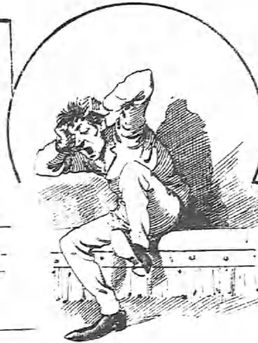
Que le dan catorce golpes á él.