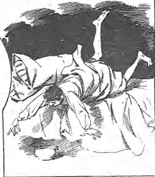
¡Que viene el toro!