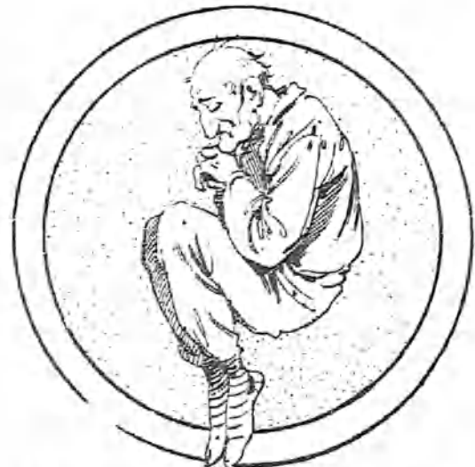
Que no ha salido todavía del claustro materno.