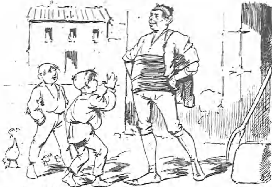
Y díjoles:—Habís de saber que me marcho pa Zaragoza.