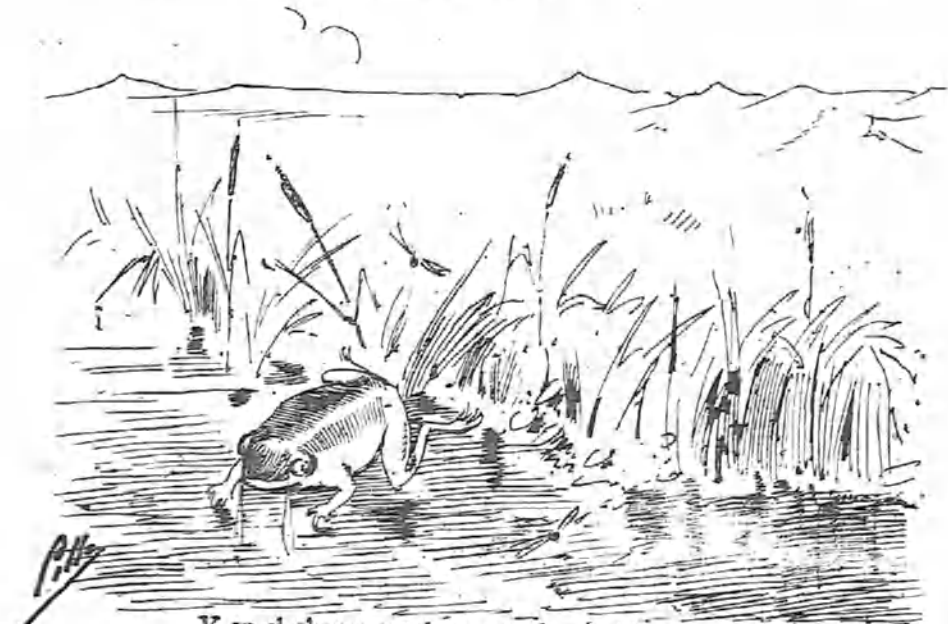
Y en el charco pasó un año de abandono, en castigo á su testarudez.