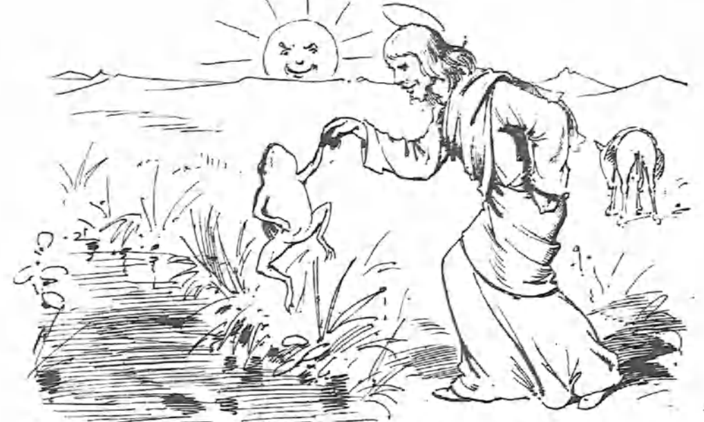
Y viendo el delegado celestial tanta obstinación, castigóle convirtiéndole en rana.