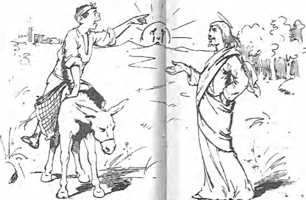
Y volvió á suplicarle que añátese el «si Dios quiere» —y tornó á no obedecer el mandato.