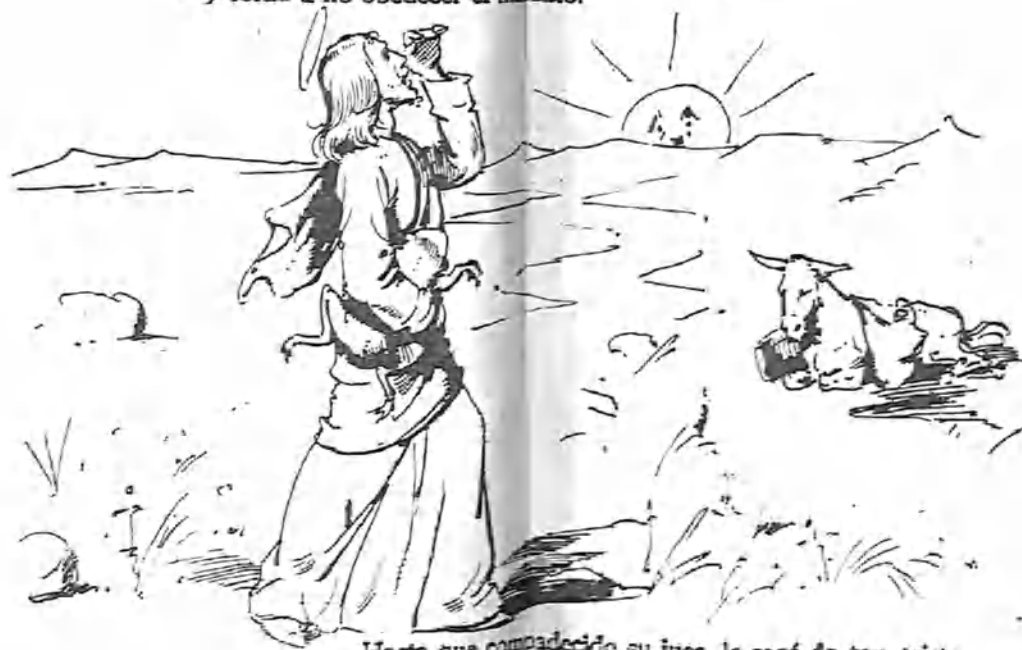
Hasta que compadecido su juez, le sacó de tan triste