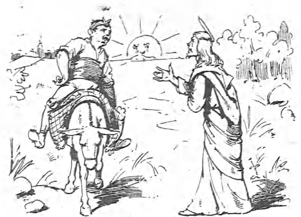
Y nete que á poco rato se le apareció un delegado celestial y díjole:—¿Dónde vas?