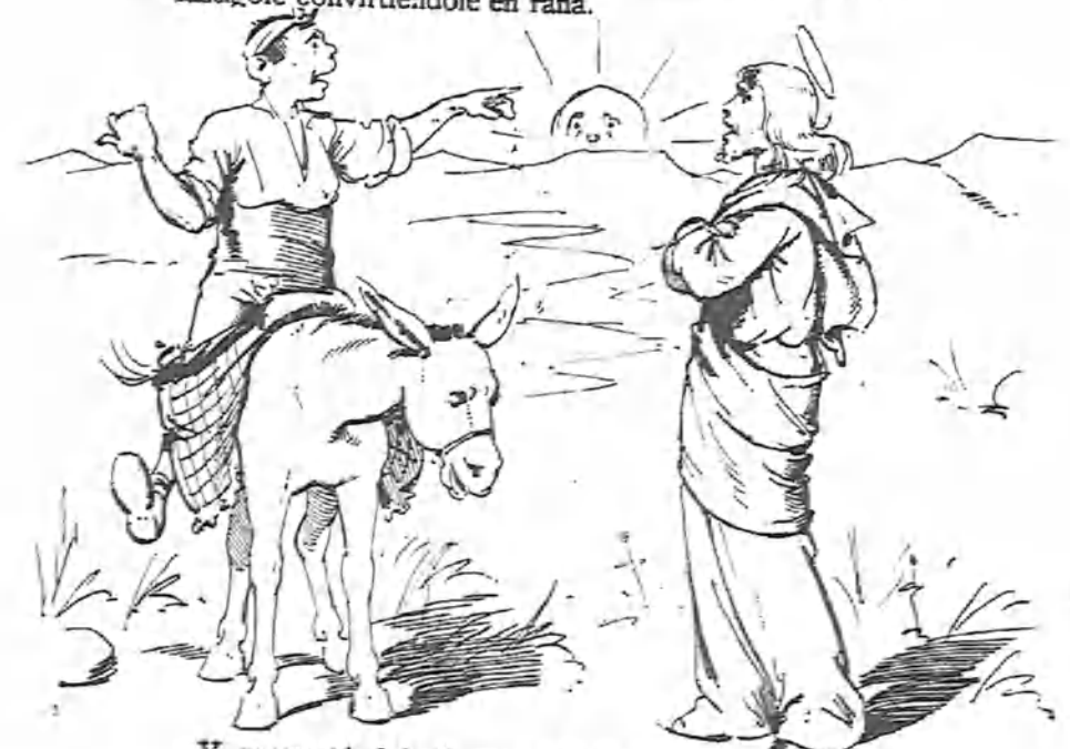
Y preguntándole luego:—¿Dónde vas ahora?— «¡A Zaragoza!» — «¿A Zaragoza?» — «¡A Zaragoza!»