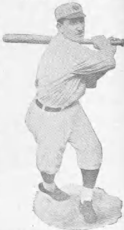
El campeón norteamericano.