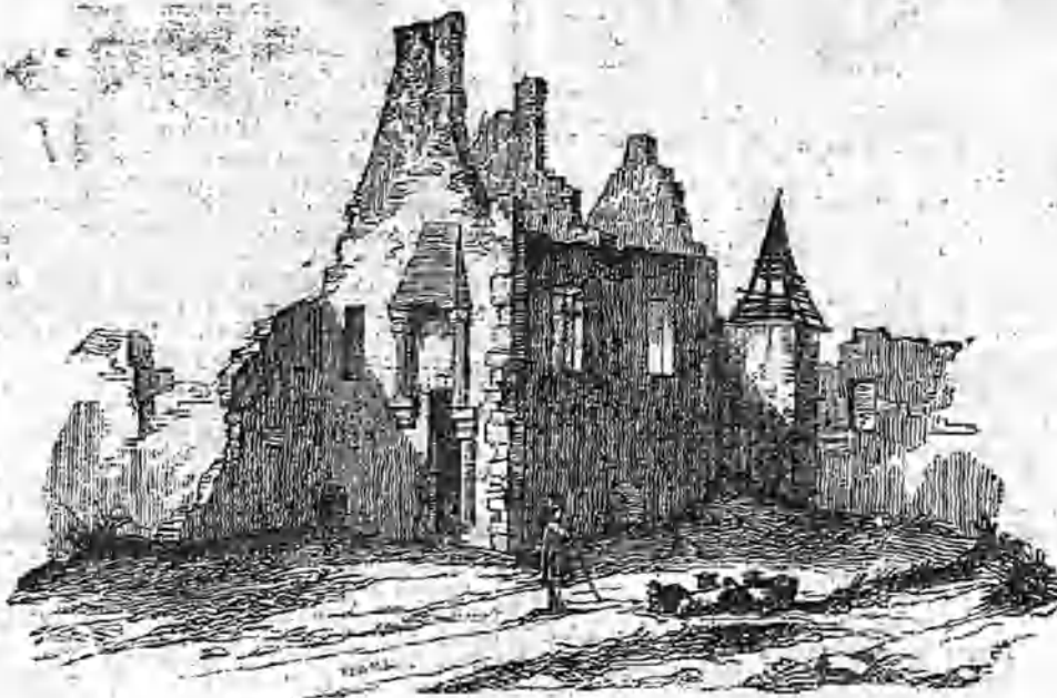
Ruinas de la casa de Juana de Arco.

(4) Encueto Carlos II a destinar a D. Fernando Valenzuela, fueron tantos los ruegos y lágrimas de la reina, que se hizo revocar la orden, dejando herido a D. Juan de Austria que en la antecámara esperaba el momento de tomar posesión del ministerio.