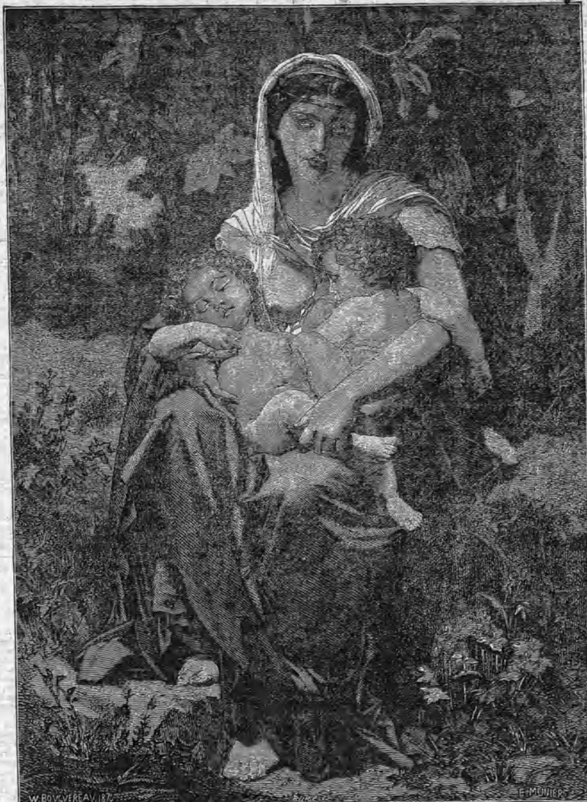
Caridad (Cuadro de M. Bouguereau.)

La poesia es en el hombre una cualidad puramente del espíritu; reside en su alma, vive con la vida incorpórea de la idea, y para revelarla necesita darla una forma. Por eso la escribe.