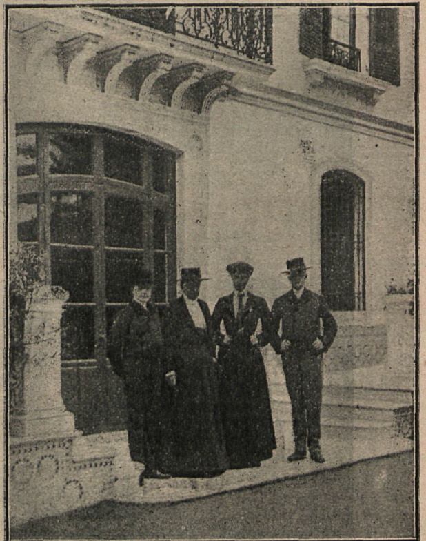
Los Príncipes de Portugal, la Condesa de París y la Princesa Luisa, momentos antes de dirigirse á la dehesa del Banco.

Desde el día 6 del corriente se encuentran en Villamanrique, al lado de su abuela la Condesa de París, los hijos de los Reyes de Portugal el Príncipe heredero D. Luis y su hermano el Infante D. Manuel.