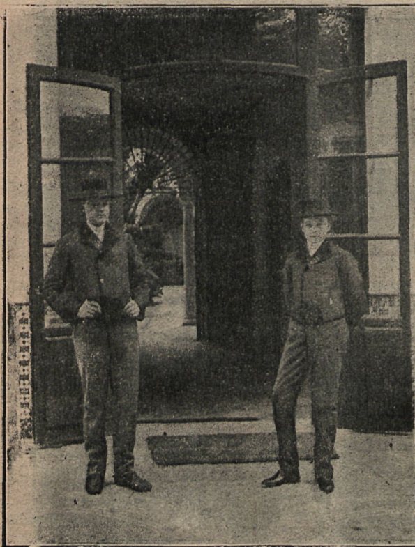
El Príncipe Luis, heredero de la Corona de Portugal, y el Infante Manuel, vestidos con el típico traje de acoso.