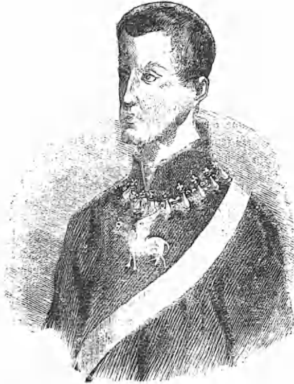
ORDEN MILITAR DEL GRIFO, DE LA JARRA Y ESTOLA DE ARAGON.