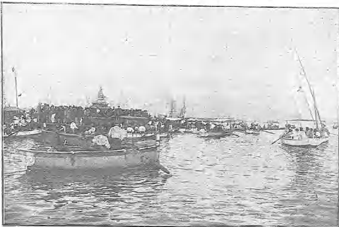
LA IMAGEN DE SANTA LUCÍA TRANSPORTADA PROCESIONALMENTE POR EL GOLFO DE NÁPOLES.

les como la del sulfato de quinina y la soricina, que se ponen florecientes por medio de la reactividad ó de los rayos X. Todas ellas emiten entonces los rayos violados y ultravioletados del espectro solar, y prácticamente equivalen a los rayos del sol en sus efectos químicos y físicos.