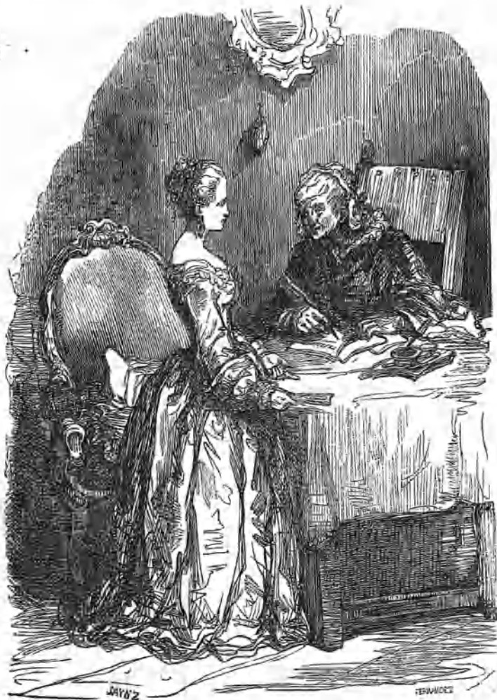
La vieja arrimó la mesa á su sillón, preparó el papel, cogió su pluma y esperó. (1)

chos años de no escitar hasta muy alto grado la atencion pública, la llama hoy con preferencia á todos. En Eugenio Sue tenemos que contemplar el novelista de antes, cándido, sencillo, trivial á veces; y el novelista de ahora, enérgico, filósofo eminente, y poeta