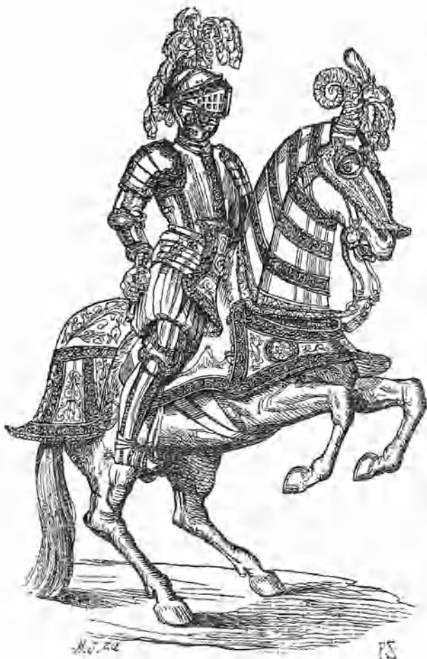
ARMADURA DE FELIPE II A CABALLO.

Si hemos de dar crédito á la tradición, esta armadura es la que Felipe II, hijo de Carlos V, y de Isabel de Portugal, llevaba puesta cuando en el sitio de S. Quintin, dirigido por Filiberto Emmanuel, Duque de Saboya, quiso presentarse á las tropas antes del asalto general que le abrió las puertas de aquella ciudad, defendida durante diez y siete dias por Coligni, con admirable valor. Esta armadura pertenecería pues á la mitad del siglo XVI, y tiene en efecto los caracteres de aquella época. Sus adornos son de una estremada finura y hermosa ejecución. El casco sobre todo, la manopla, la rodillera, y la parte de la armadura que cubre el cuello del pie, parecen trabajadas con mucho cuidado. Debe notarse como una particularidad curiosa, la especie de cuernos encorvados que cubren la parte superior de la cabeza del caballo; en cuanto al penacho que adorna el casco del Rey, es evidentemente de una época posterior á aquel y á la armadura, y se ha tenido poco gusto en ponerlo.